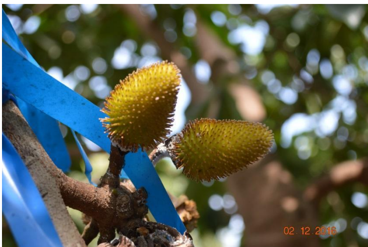
Figura 4. Desarrollo inicial de erizos producto de la polinización manual en guanábana. EELS, INIAP, 2016.