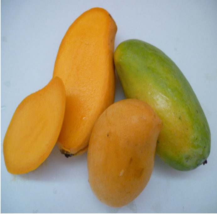
Figura 8. Frutos de línea promisoría de mango de la EELS del INIAP. 2016.