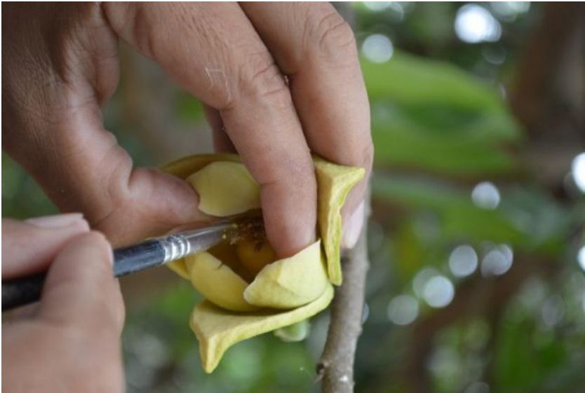
Figura 3. Polinización manual de una flor de guanábana. EELS, INIAP, 2016.

Para la obtención de frutos con un desarrollo físico completo se realizó polinización artificial, para lo cual se obtuvo polen de plantas donantes vecinas, obteniéndose resultados satisfactorios. Estos frutos fueron luego analizados en laboratorio en donde se determinaron las variables físico-químicas del fruto.