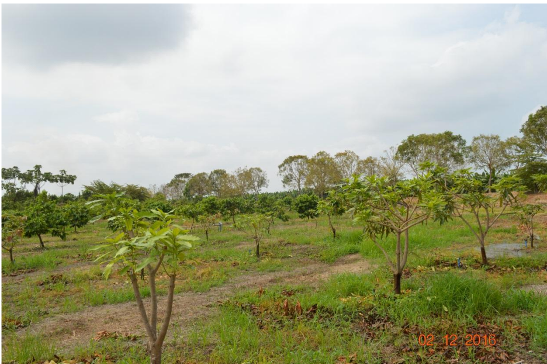
Figura 13. Trabajos de poda en el germoplasma frutal del lote 2 de la EELS. INIAP. 2016.