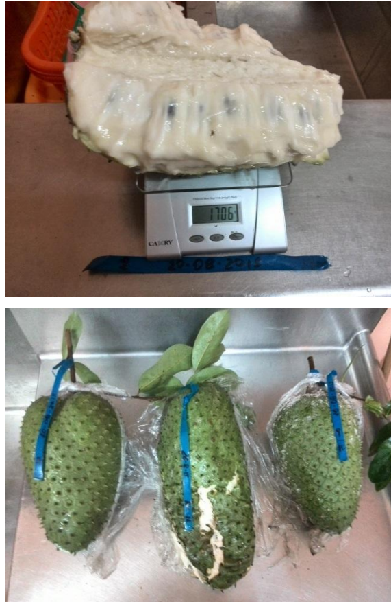
Figura 6. Frutos comerciales de una línea mejorada de guanábana. EELS, INIAP, 2016.