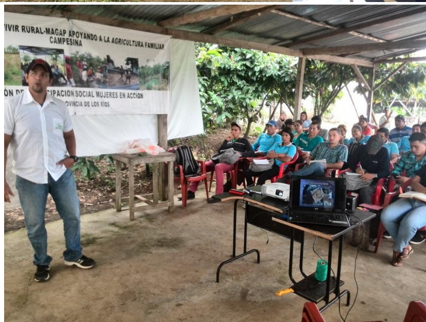
Figura 2. Capacitación en Guanábana a productores de la provincia de Los Ríos. EELS, INIAP.2016.