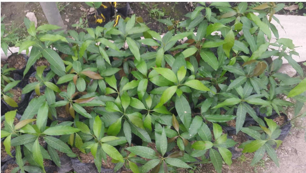
Figura 10. Plantas F1 producto de la hibridación de mango tipo amarillo. EELS, INIAP, 2016.

Producto de la hibridación dirigida se obtuvo una población inicial de 200 individuos que están en proceso de germinación y crecimiento