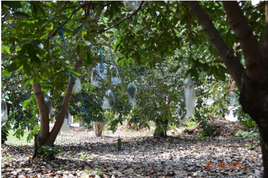
Figura 5. Germoplasma de guanábana en la EELS con producción controlada y evaluada. EELS, INIAP, 2016.

Con base en los resultados en el germoplasma de Guanábana de la EELS, se puede indicar que existen accesiones que presentan características agronómicas superiores en cuanto a expresión reproductiva y calidad del fruto.