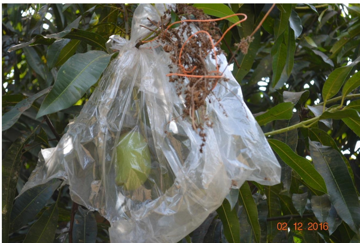
Figura 9. Fruto de mango tipo amarillo obtenido por hibridación. EELS, INIAP, 2016.

Para proceder a la hibridación los árboles madres fueron aislados por medio de barrera física para evitar la contaminación con polen no deseado y fueron hibridados con polen del padre seleccionado.