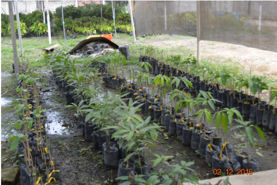
Figura 7. Plantas injertadas de mango y guanábana listas para ser establecidas en ensayos regionales. . EELS, INIAP, 2016.