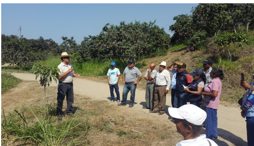
Figura 1. Capacitación el cultivo de mango a productores la provincia El Oro. EELS, INIAP.2016