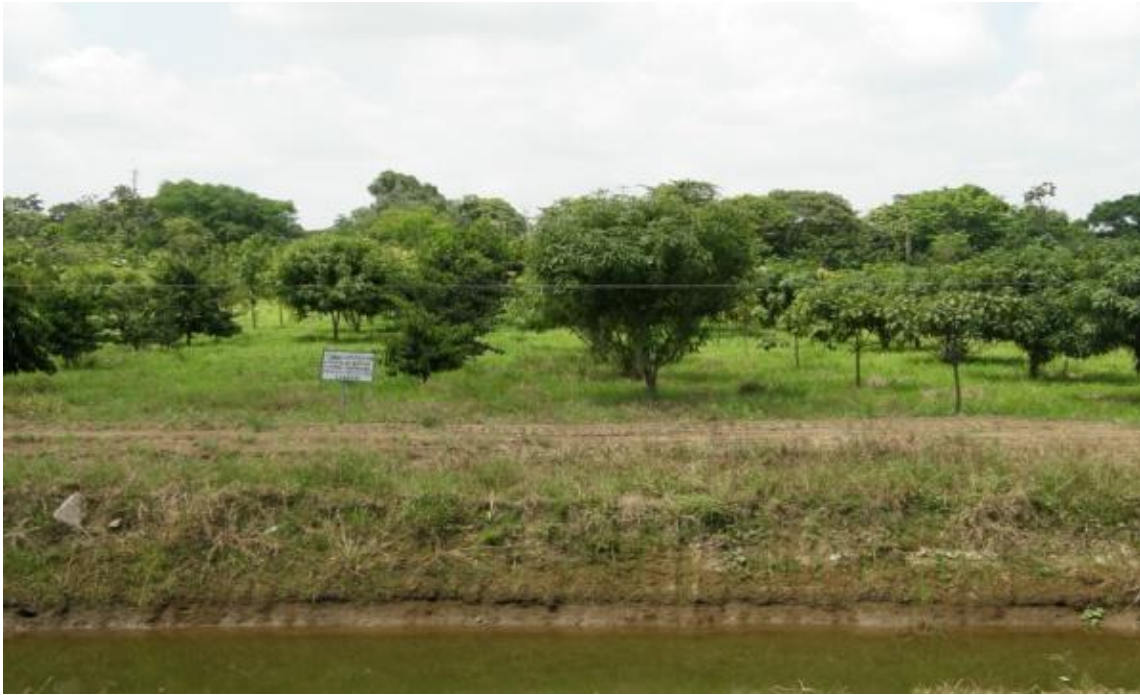
Figura 14. Colección de frutales nativos en el lote 6 de la EELS. INIAP. 2016.