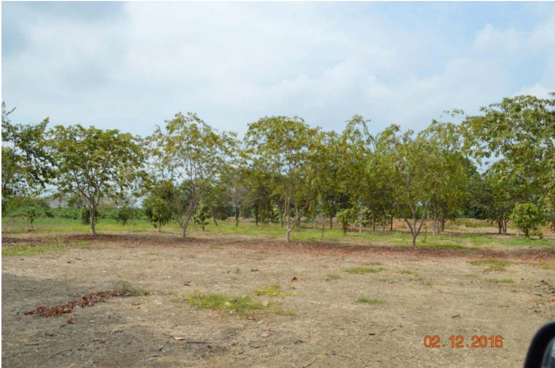
Figura 12. Colección de frutales nativos en el lote 2 de la EELS. INIAP, 2016.