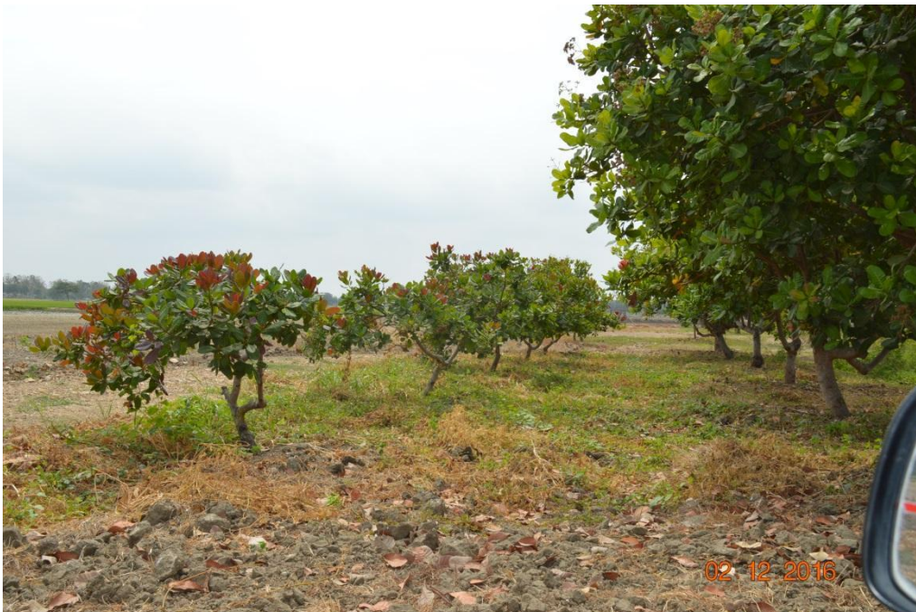
Figura 11. Accesiones de marañón ( Anacardium occidentale L.) en la colección de frutales nativos de la EELS.. INIAP, 2016.