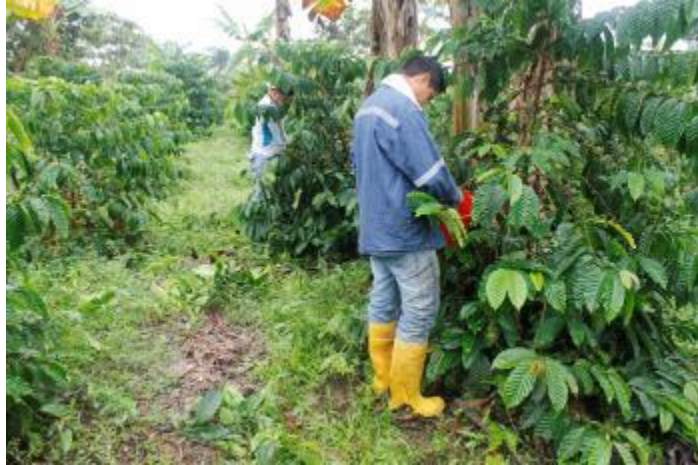
Fotografía 7. Cosecha del ensayo de fertilización de café - EECA.