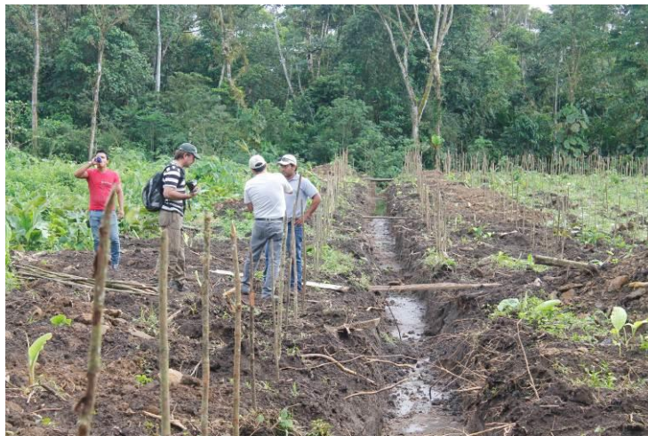
Fotografía 5. Visita del Coordinador Nacional al ensayo de café arábigo - G.E. Palora.