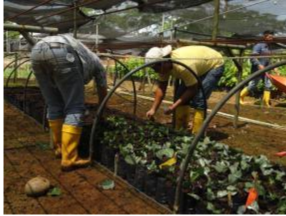
Fotografía 4. Multiplicación de plantas de café robusta - EECA.