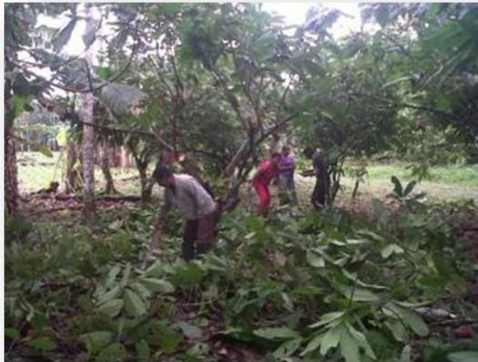
Fotografía 8. Poda de cacao en finca de productores INIAP – AFAM - CATIE.