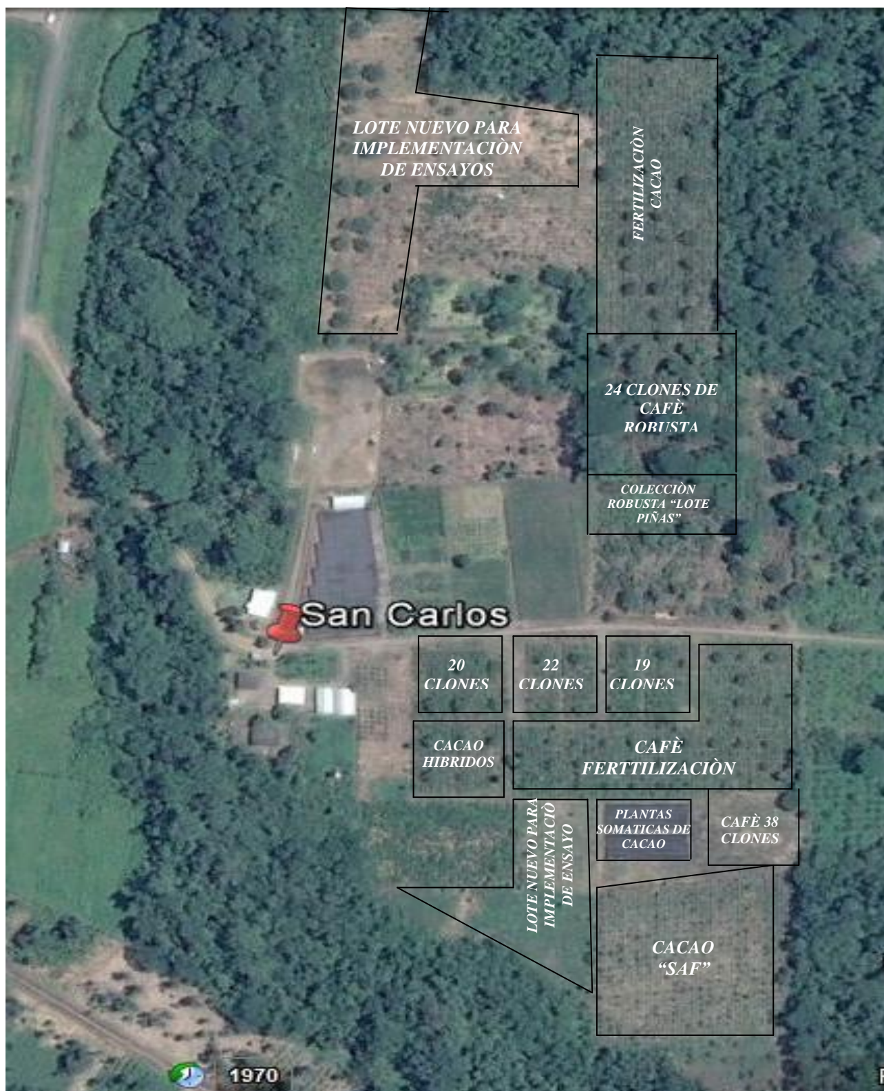
Imagen 1. Ubicación de los ensayos del PCC en la EECA. 2014