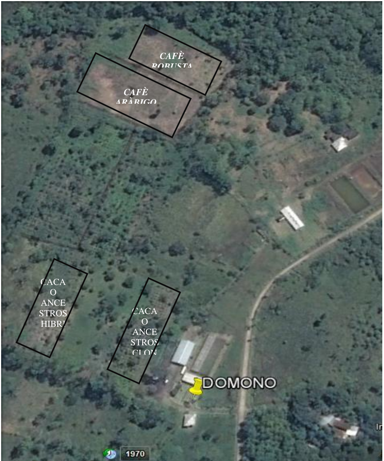
Imagen 2. Ubicación de los ensayos del PCC en la Granja Domono. 2014