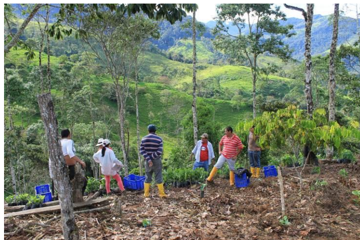
Fotografía 6. Siembra de ensayo regional de café arábigo.- Palanda