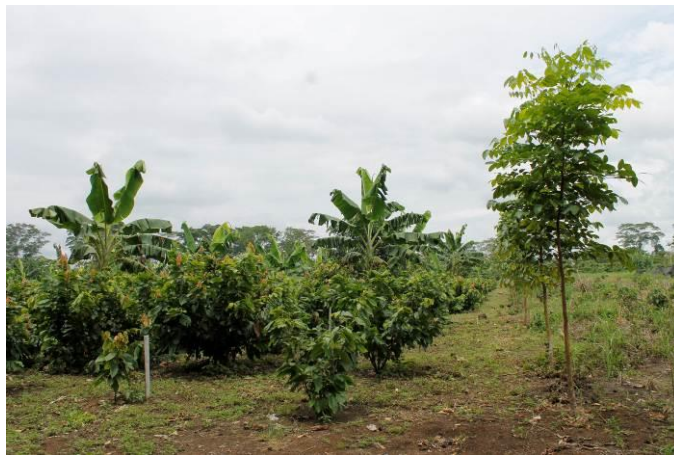
Fotografía 2. Ensayo de clones promisorios de cacao bajo SAF - EECA.