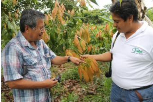
Fotografía 1. Visita del Líder Nacional a la colección de ancestros de cacao - G.E. Domono.