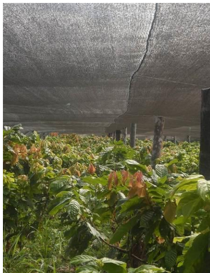
Fotografía 3. Jardín de plantas somáticas de cacao - EECA.