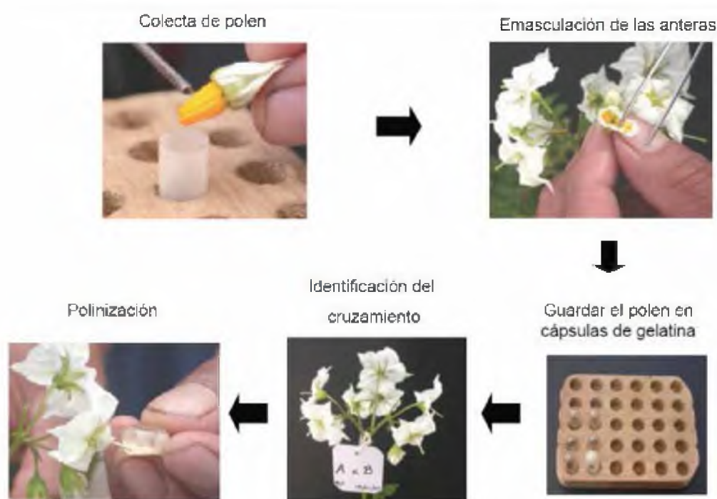
Figura 3. Procedimiento para efectuar las polinizaciones en un bloque de cruzamientos.

La polinización consiste en colocar el polen sobre el estigma de las flores del progenitor femenino con el fin de inducir artificialmente el proceso de fertilización y fecundación. Las polinizaciones deben realizarse usualmente en la mañana antes de las 10 am, si los días son calurosos es posible hacerlos al final de la tarde. El probable éxito del cruzamiento es apreciado por un pedicelo sostenido y ligeramente curvado, unos 2-4 días después de la polinización, con un posterior desarrollo de frutos (bayas). Una vez realizado el cruzamiento, se colocará una etiqueta con los nombres de los progenitores, la fecha de emasculación, fecha de polinización, número de flores cruzadas, la hora en que se realizó el cruzamiento y el nombre de la persona que realizó el cruzamiento (Orillo and Bonierbale, 2009) ( Figura 3 ).