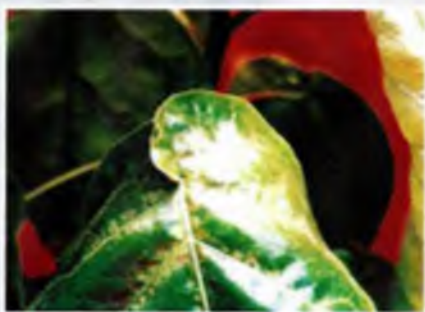
Foto 8. Lesiones iniciales paralelas a las nervaduras e irregularidades en hojas