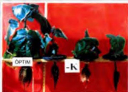
Foto 7. Deficiencia de potasio comparado con testigo óptimo