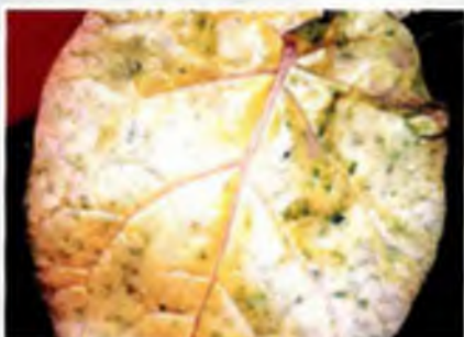
Foto 5. Clorosis generalizada con puntuaciones verdosas