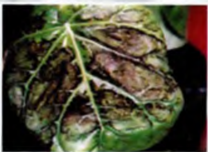
Foto 9. Necrosamientos intervenales a manera de quemazones