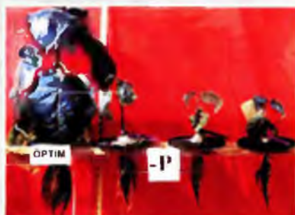
Foto 4. Deficiencia de fósforo comparado con testigo óptimo