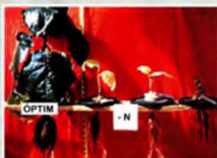
Foto 1. Deficiencia de nitrógeno comparado con testigo óptimo, plantas pequeñas amarillentas