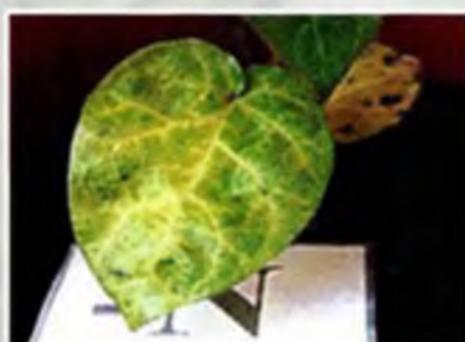
Foto 2. Clorosis generalizada en hojas bajas