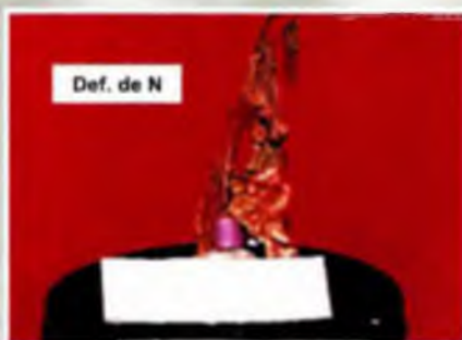
Foto 3. Muerte de las plantas con deficiencia de nitrógeno