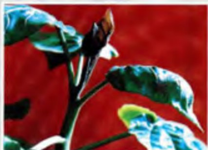
Foto 20. Deformación de hojas jóvenes en forma de "Hoz o Caparazón"