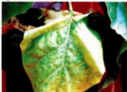
Foto 23. Clorosis amarillenta desde los bordes hacia el centro en hojas bajas