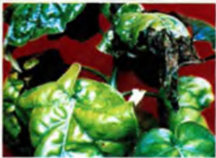
Foto 15. Deformación foliar y necrosamientos de los ápices de las hojas