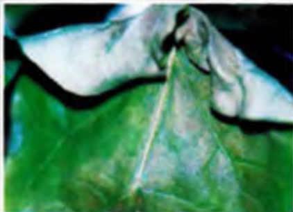
Foto 24. Flaccidez en las hojas y apariencia de quemazón, bordes de la base doblados hacia el haz