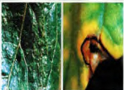
Foto 18. Lesiones necróticas con halo amarillento e irregularidades a manera de estrías en hojas intermedias