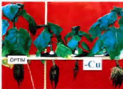
Foto 22. Deficiencia de cobre comparado con testigo óptimo