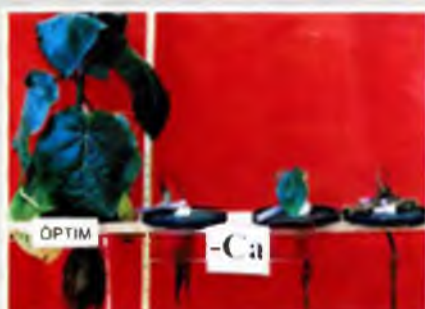
Foto 10. Deficiencia de calcio comparado con testigo óptimo