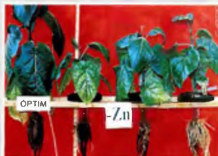
Foto 19. Deficiencia de Zinc comparado con testigo óptimo