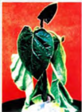
Foto 11. Hoja punta de flecha y muerte descendente