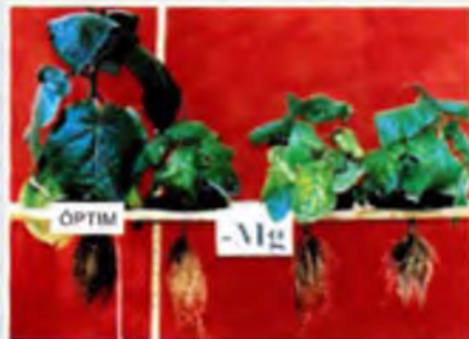
Foto 13. Deficiencia de magnesio comparado con testigo óptimo