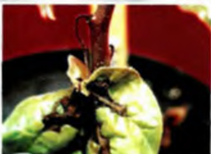
Foto 6. Necrosamiento de la base de la hoja y muerte del pecíolo