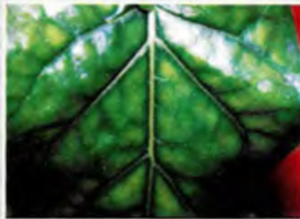
Foto 14. Clorosis internerval a manera de V invertida