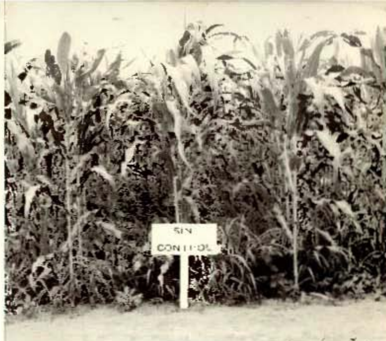
En la fotografía de arriba se ve una parcela de maíz invadida de malezas. Dará una mala cosecha. En la fotografía de abajo se aprecia una parcela en donde se aplicaron productos químicos para combatir las malas hierbas. Dará una buena cosecha.