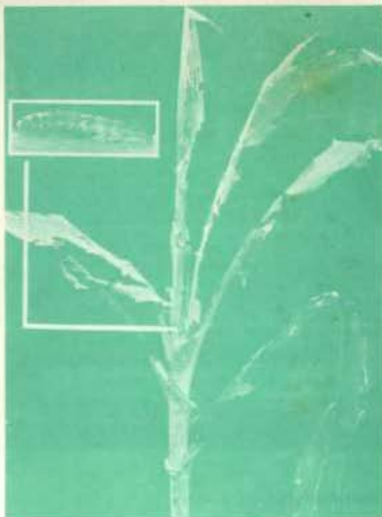
El "Gusano cogollero" es un gran enemigo del maíz; vive en el cogollo de la planta y se alimenta de las hojas tiernas. En la foto vemos una planta atacada por el Cogollero (Langosta).