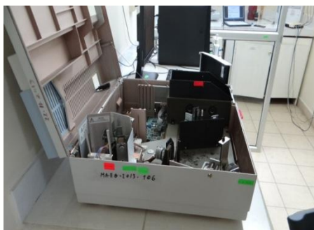
Fotografía 4. Mantenimiento medidor de pH