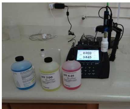
Fotografía 3. Mantenimiento medidor de pH