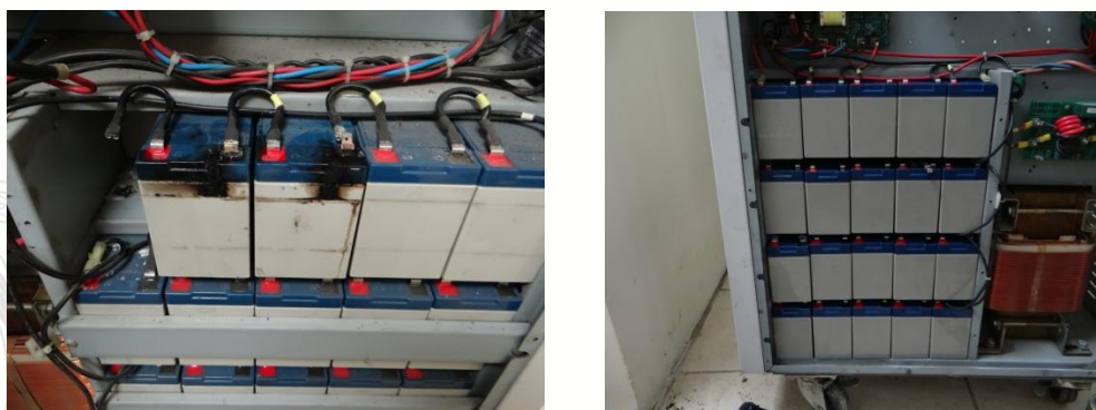
Fotografías 1-2. Mantenimiento correctivo UPS 10KVA