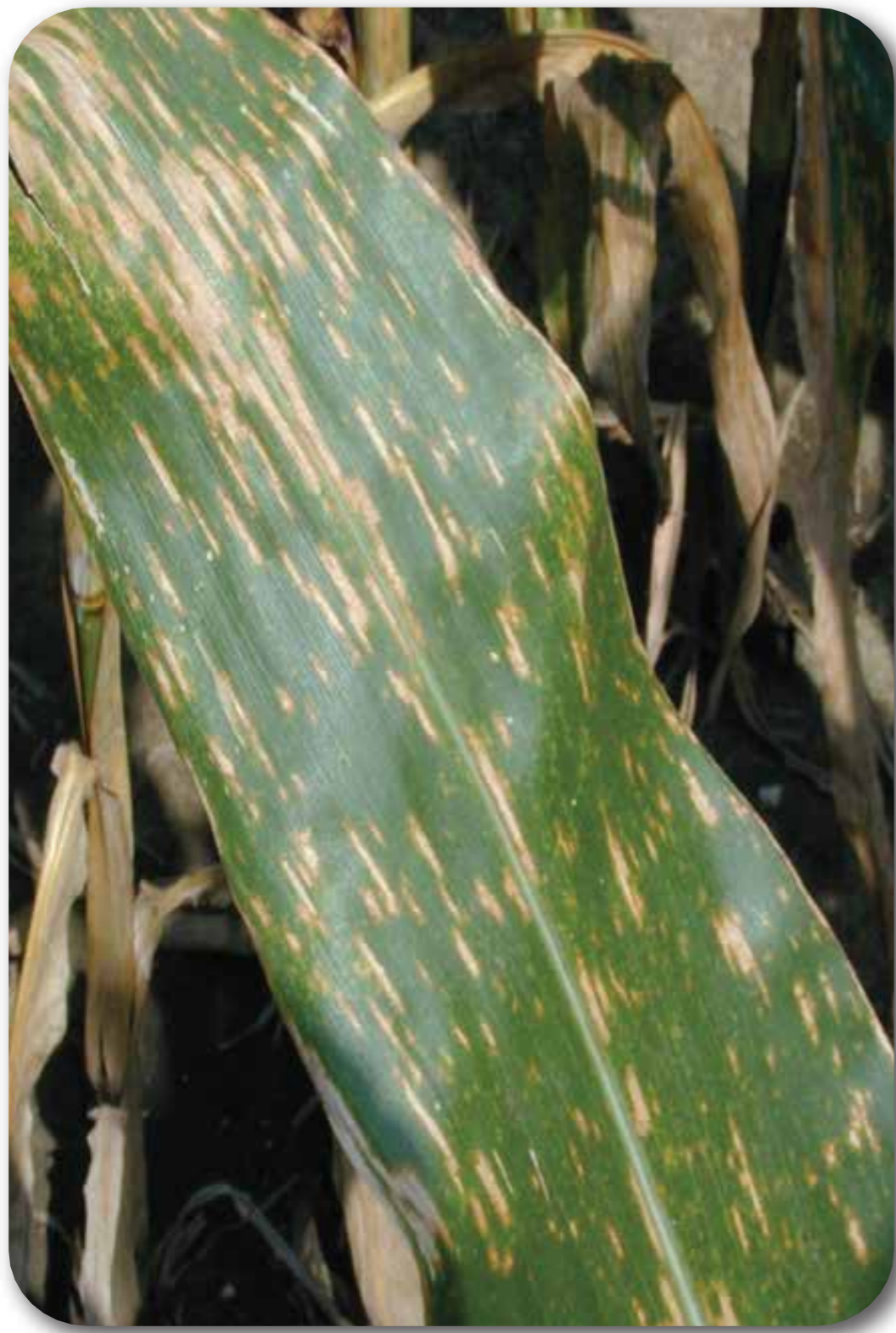
Mancha gris ( Cercospora zeae-maydis )