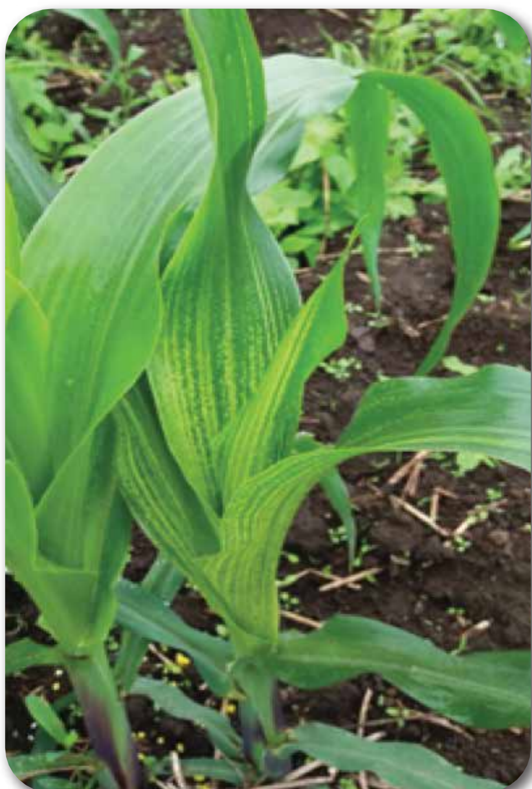
Virus del rayado fino ( MRFV )