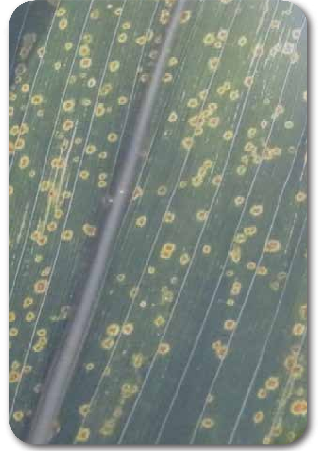
Mancha ocular ( Kabatiella zeae )