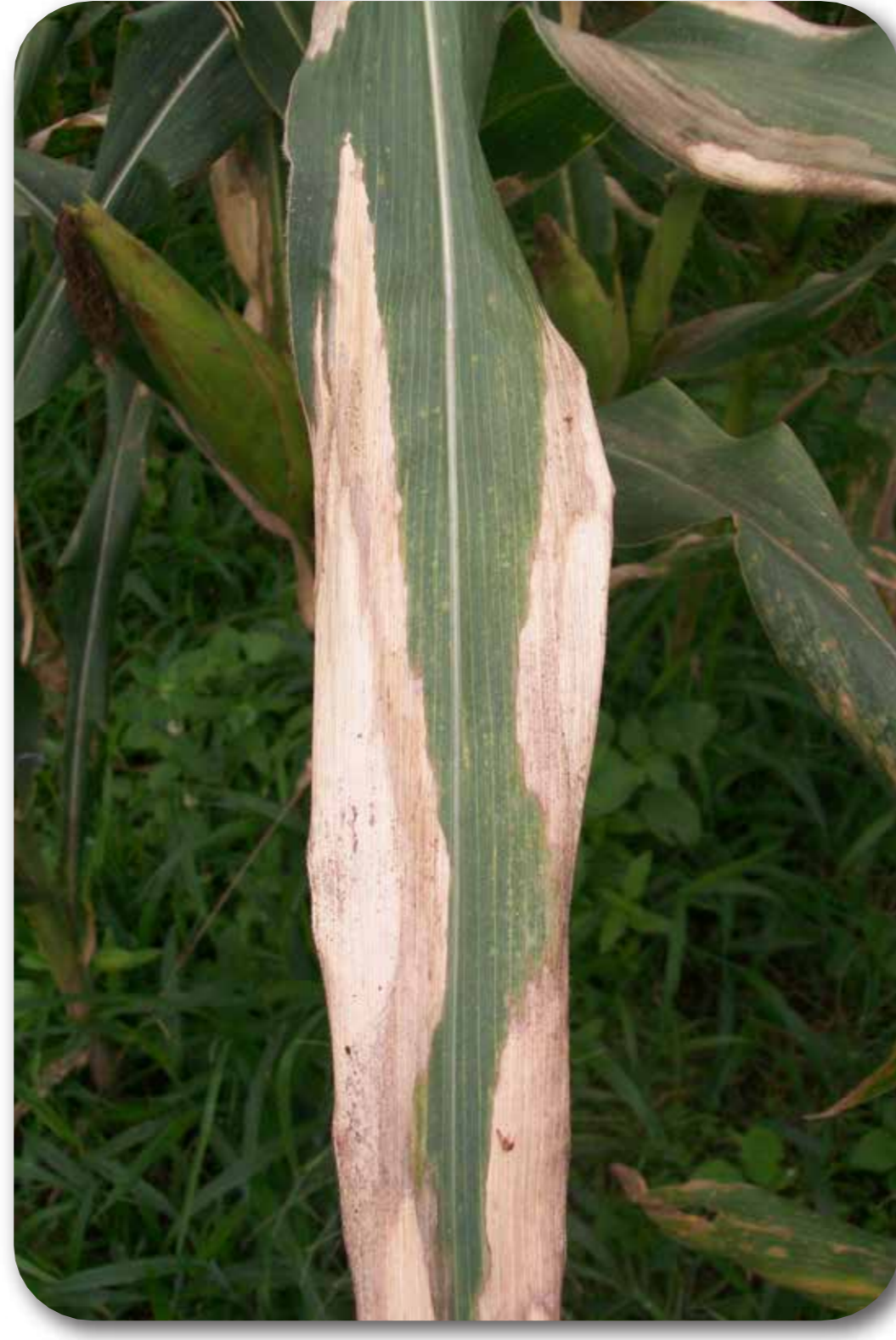
Tizón ( Exserohilum turcicum ; Helminthosporium turcicum )