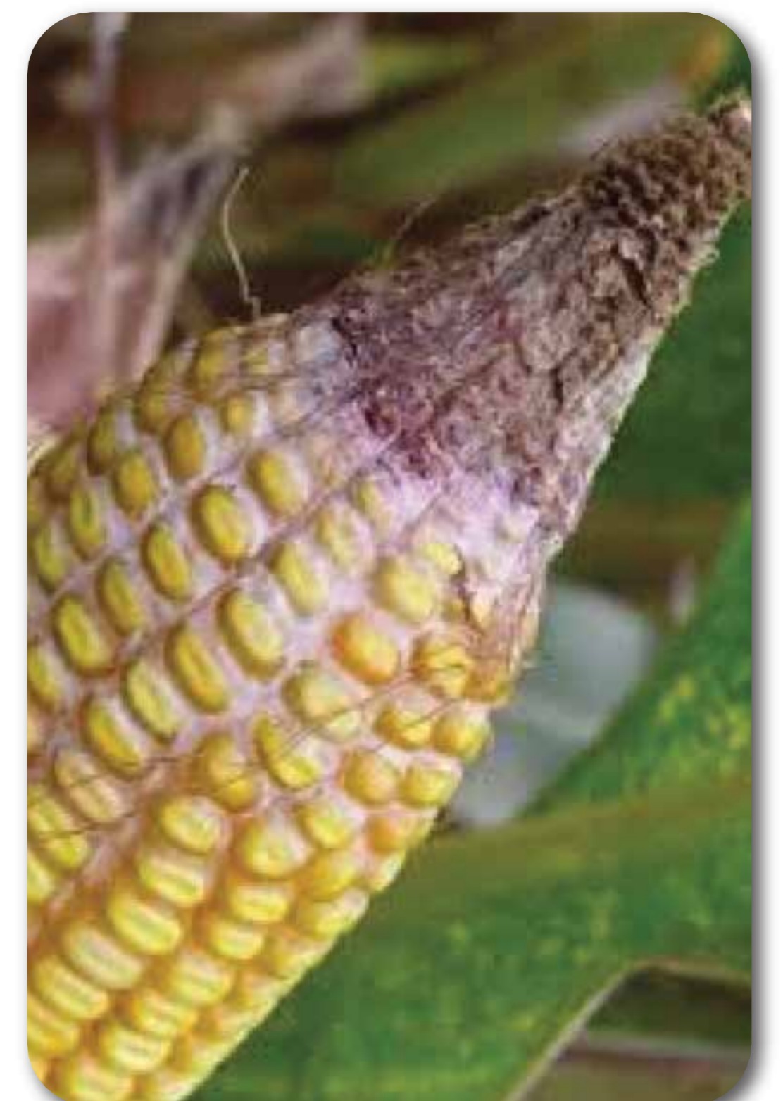
Pudrición de mazorca ( Fusarium spp. , Diplodia sp. )