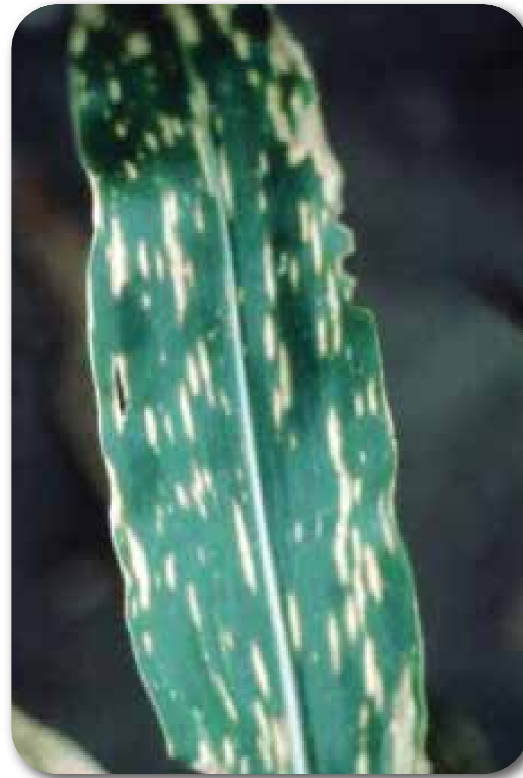
Tizón del sur ( Bipolaris maydis , Helminthosporium maydis )