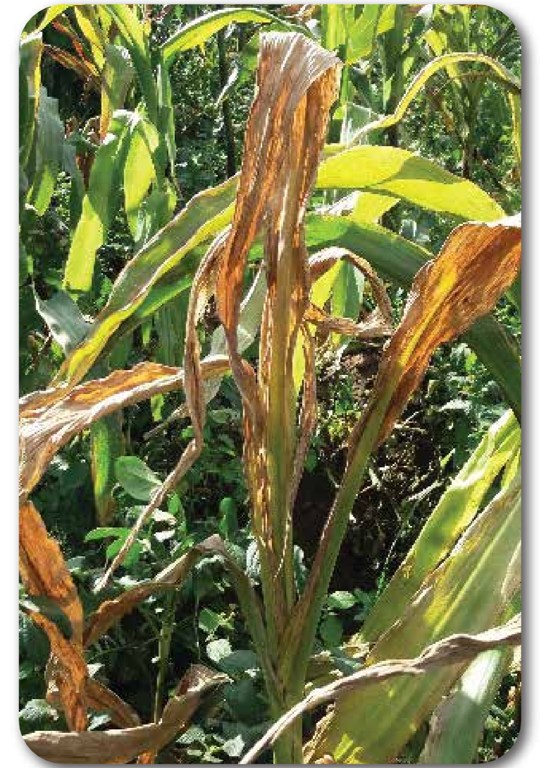
Pudrición del cogollo ( Dickeya zeae , Erwinia spp. )