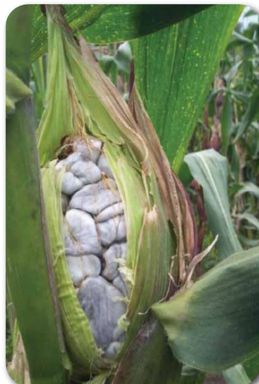
Carbón ( Ustilago maydis )