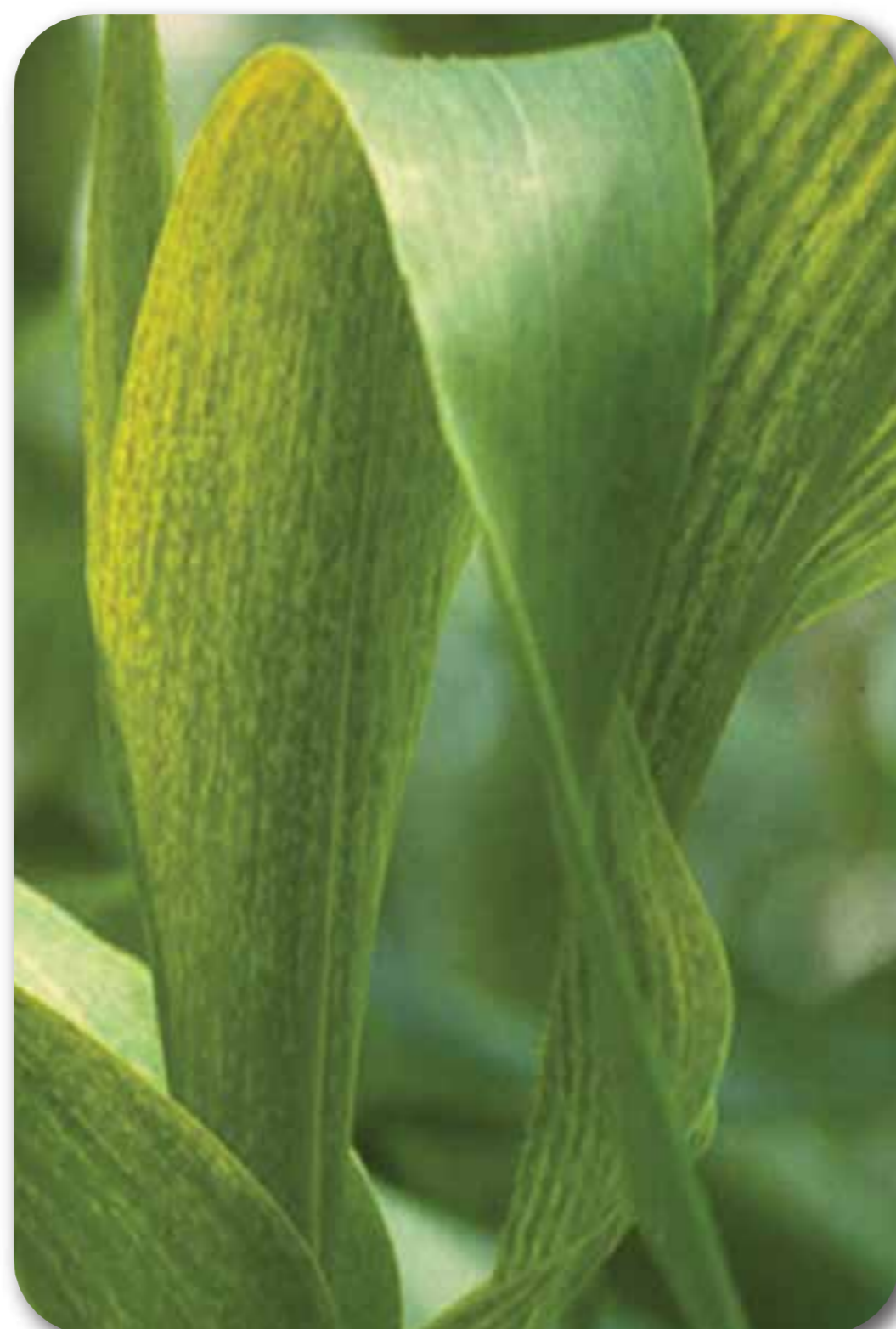
Virus del mosaico ( SCMV , MDMV )