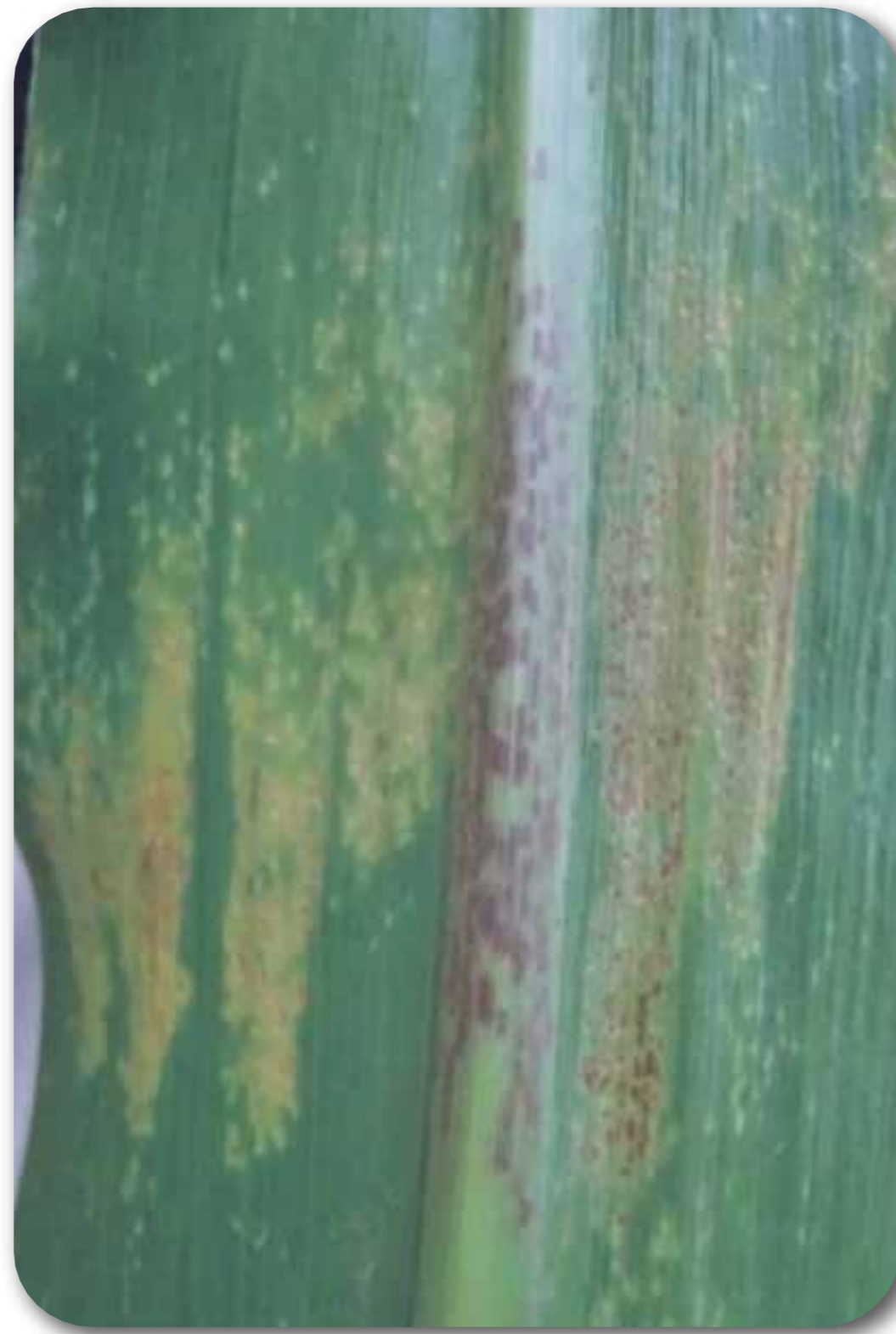
Mancha café ( Physoderma maydis )