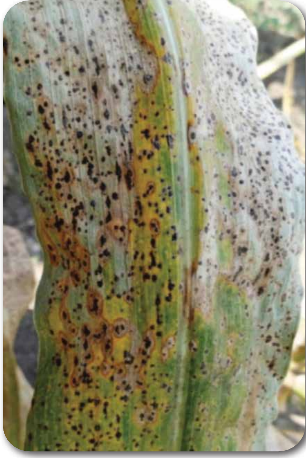
Mancha de asfalto ( Phyllachora maydis + Monographella maydis + Coniothyrium phylachorae )