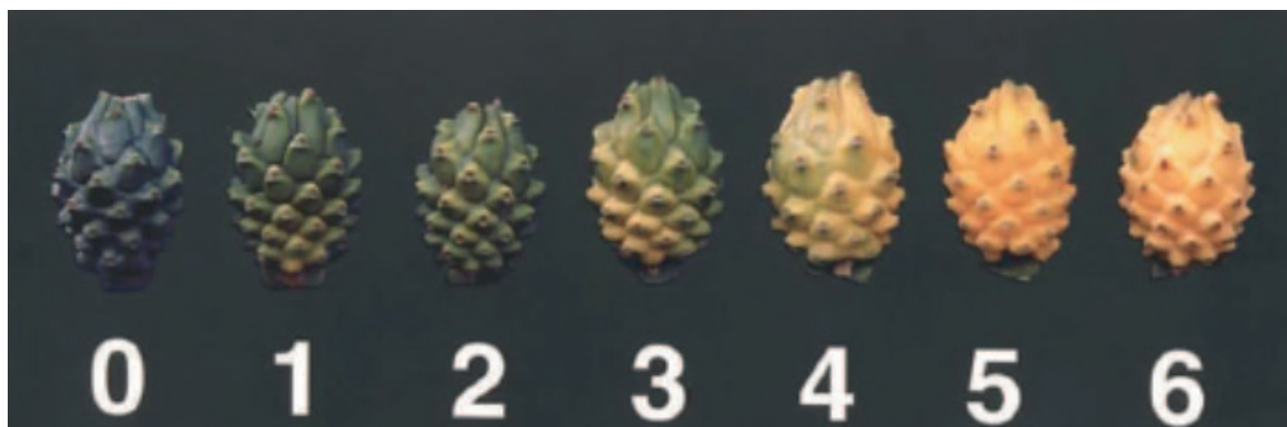
Figura 1. Tabla de color de pitahaya amarilla, según la Norma Técnica Colombiana NTC- 3554,1996

Se colectaron 15 frutos en cada estado para registrar las variables peso fresco (g), mientras que para las variables de porcentaje de pulpa y cáscara, firmeza de la pulpa (N), sólidos solubles (°Brix), pH, acidez (%) y evaluación sensorial se tomaron 15 frutos del estado 0 y 6, respectivamente. El peso fresco se registró utilizando una balanza digital (Citizen Scale, modelo CG 4102C; precisión de 0.01 g). La firmeza se determinó con un penetrómetro manual (Force Gauge, modelo GY-4) provisto con un puntal de 3.50 mm de diámetro, realizando dos lecturas en la parte ecuatorial del fruto, y los resultados se expresaron en Newtons (N). El contenido de sólidos solubles totales (°Brix) se midió utilizando un refractómetro digital (Hanna instruments, modelo Hi 96801, USA), el pH con un potenciómetro (BOECO, modelo PT-380) y la acidez titulable (expresada como % ácido cítrico); todas las variables se midieron con la metodología descrita por la AOAC (2012).