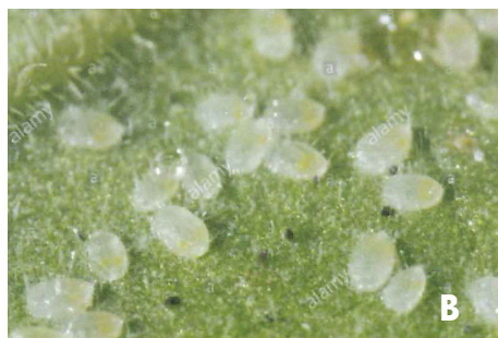
Figura 5. (A) Ninfas del psílido de la papa ( B. cockerelli ). (B) Ninfas de mosca blanca ( Bemisia tabaci ).