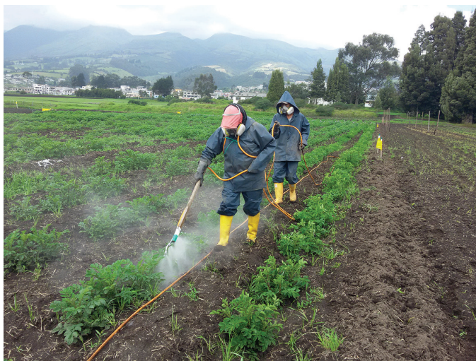
Figura 7. Aplicación de insecticidas en cultivo de papa para manejo del psílido de la papa ( B. cockerelli ).

La propuesta está basada en ocho aplicaciones que dependerán de factores ambientales y del resultado de los monitoreos. Es una propuesta referencial por lo que cada técnico deberá establecer su propia estrategia de control según las zonas.