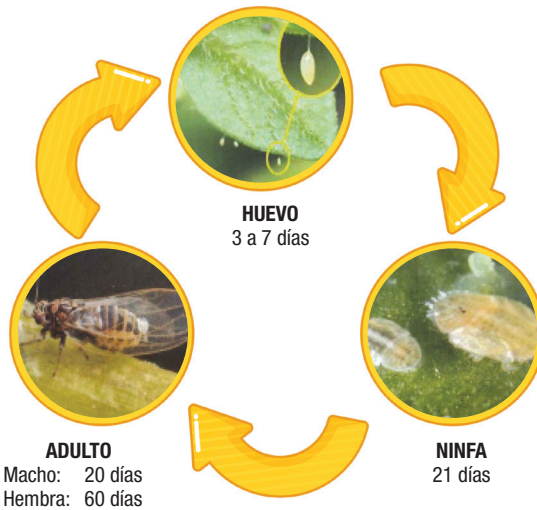
Figura 2. Estadios de desarrollo de Bactericera cockerelli .

Su ciclo de vida inicia en ovipositoras, pasa por cinco estadios ninfales y por adulto (Figura 2). Los huevos miden alrededor de 0.3 mm de largo son de color amarillo con un pedicelo que lo une con la hoja. El tiempo para el desarrollo desde huevo a ninfa es de 3 a 7 días. Las ninfas son aplanadas como una escama de color verdoso amarillento, ojos rojizos. Su tiempo de desarrollo es de 21 día en promedio. Cuando se les toca, se mueven, a diferencia de las ninfas de mosca blanca que no lo hacen (Figura 5, A).