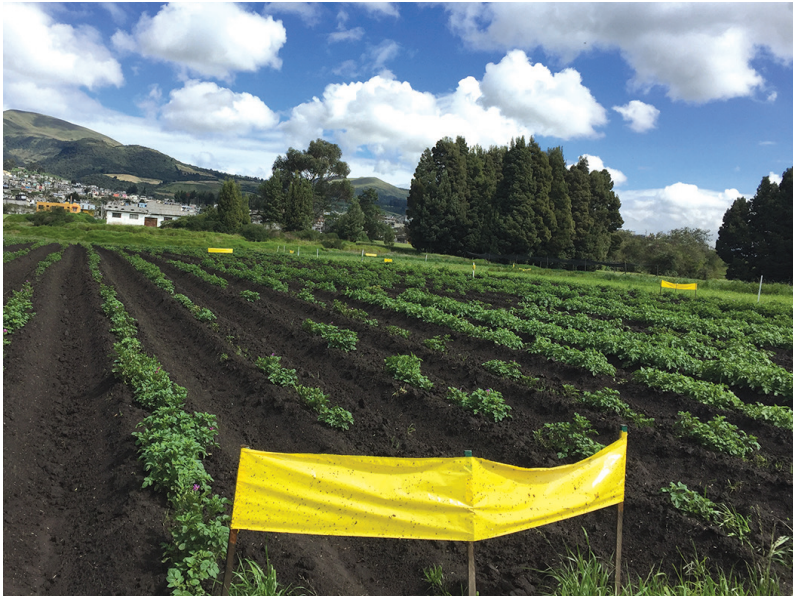
Figura 6. Trampa amarilla pegajosa para el monitoreo del psílido de la papa

Debido al tamaño de los psíldos es necesario utilizar una lupa para verlos con claridad. Al momento de detectar la presencia de psíldos en las trampas se debe iniciar con los controles recomendados.