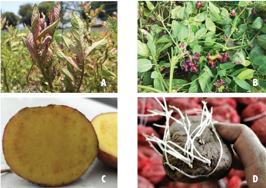
Figura 1. Síntomas de punta morada en papa: (A) hojas moradas, (B) tubérculos aéreos, (C) papa rayada y (D) brotes ahilados.

Las plantas enfermas presentan un desarrollo anormal, algunas presentan enanismo, en otras las ramas o tallos sobresalen, las hojas superiores se enrollan, se tornan amarillas o moradas, existe un engrosamiento de los nudos del tallo, la distancia entre los nudos del tallo se acorta, el tallo crece en zig zag, se forman tubérculos aéreos y la planta puede presentar una muerte temprana (Figura 1, A, B).