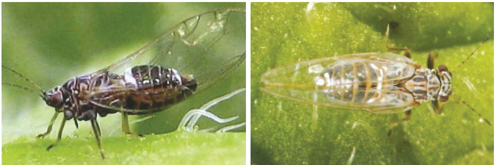
Figura 3. Adulto del psílido de la papa ( B. cockerelli ) (Vista lateral y dorsal).