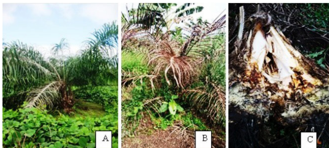
Fig. 3: A) Planta con síntomas de avance de una pudrición de flecha. B) Planta totalmente afectada por una extraña pudrición de hojas adyacentes al cogollo. C) Meristemo totalmente necrosado.