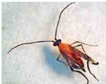
Adulto de Monalonia

Las ninfas recién emergidas empiezan a alimentarse inmediatamente, causando daño en la mazorca, en 20 días pasa por cinco instares ninfales hasta convertirse en adulto, cuya longevidad es de seis a ocho días. Se ha determinado que tanto el adulto como las ninfas se alimentan sobre la mazorca de cualquier tamaño y color.