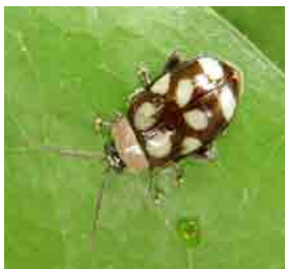
Adulto de Omophota sp, en hoja

Hay un grupo de coleópteros que en estado adulto se alimentan del follaje del cacao, en la región intervenal, preferentemente de hojas y brotes tiernos. Entre ellos se reportan a Omophota sp. y Diabrotica spp., cuyos daños se caracterizan por perforaciones circulares bien definidas de aproximadamente 5 a 10mm. Mientras que el daño de Epitrix sp. consiste en una gran cantidad de perforaciones por toda el área foliar.