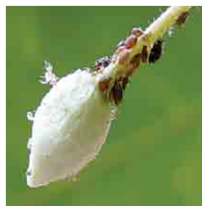
Colonia de pulgones en botón floral de cacao