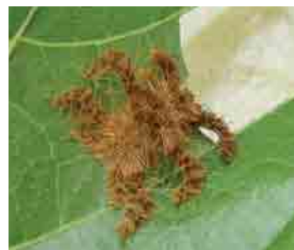
Complejo de larvas de lepidopteros defoliadores del cultivo de cacao, de las familias Saturniidae, Nimphalidae, Limacodidae y Megalopygidae