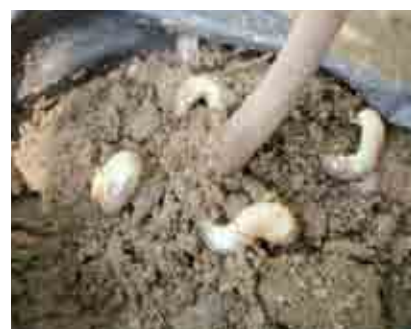
Larvas de Phyllophaga afectando raíces de plantas de cacao en vivero