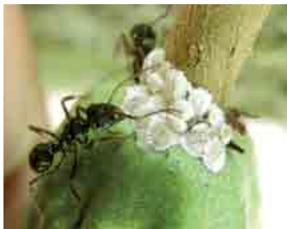
Hormiga arriera asociada a colonia de cochinillas en mazorca de cacao

Es común observar a las cochinillas asociadas a hormigas en un sistema de simbiosis, donde las hormigas se alimentan de las secreciones azucaradas de las cochinillas, que a su vez reciben protección de sus enemigos naturales por parte de las hormigas.