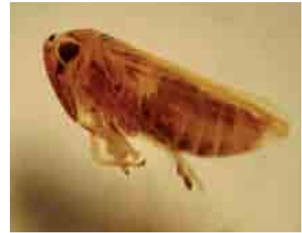
Adulto de Agallia sp.

castaño. La literatura menciona que estos insectos a más del corrugamiento, pueden ocasionar una fuerte atrofia de las hojas, con necrosamiento de los bordes apicales, sintomatología parecida a la provocada por deficiencias de boro.