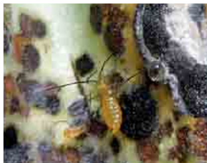
Ninfa y daño de Monalonia

Durante su alimentación el insecto inyecta ciertas toxinas que aceleran la muerte de las células que rodean la picadura. Las mazorcas atacadas presentan manchas necróticas circulares de aproximadamente 4mm. El fruto puede ser atacado en cualquier edad, sin embargo, frutos jóvenes de siete a 12 semanas y de 10 a 12 cm, se tornan negros, se endurecen y mueren. Aparentemente, la disminución de las lluvias coincide con el aumento de las poblaciones, también la sombra deficiente tiene influencia sobre su desarrollo.