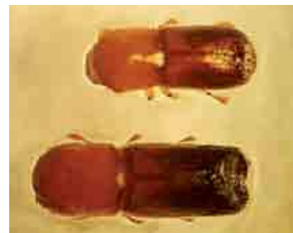
Adultos de Xyleborus spp.

El daño es causado por los adultos, los cuales ocasionan gran cantidad de galerías independientes una de otras, aunque en algunas casos se pueden entrecruzar, presentándose en forma de serpentina. Su ataque se concentra principalmente en la parte basal del tallo, alcanzando en algunas oportunidades la zona radicular más cercana a la superficie.