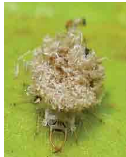
Larva de Chrysopa sp.