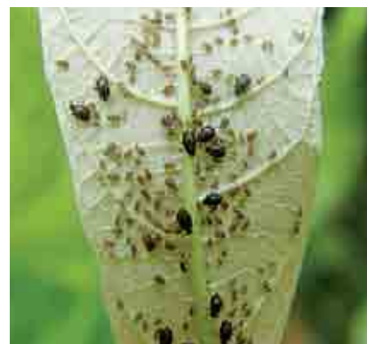
Colonia de pulgones en hoja de cacao

El pulgón del cacao vive en asociación con hormigas que se alimentan de las secreciones azucaradas que producen éstos. Las hormigas a su vez protegen a los pulgones de sus enemigos naturales. Las mayores poblaciones del pulgón coinciden con las épocas de floración y abundancia de rebrotes.