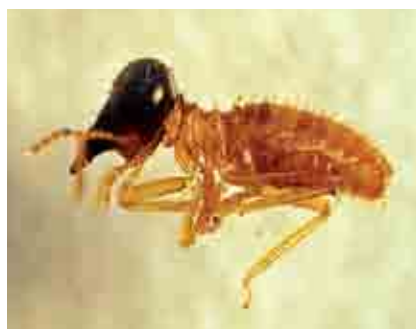
Adulto de Monalonium

Otros barrenadores en el cacao son las termitas. Estos isópteros son insectos que tiene un sistema de castas muy desarrollado. Las colonias pueden vivir en el suelo, la madera o árboles en pie. Generalmente en cada colonia se encuentran cuatro castas que son: reproductores, reproductores suplementarios, obreros y soldados. Algunas especies como la reportada en cacao Nasutitermes sp. (Isoptera: Termitidae), cuentan con una quinta casta de individuos llamada nasuta.