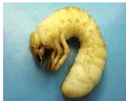
Larva de Phyllophaga sp.

Sus larvas pasan por tres instares y son del tipo scarabiforme por adoptar su cuerpo siempre la forma de “C”. Pupa en el suelo y el adulto emerge con las primeras lluvias. El tercer instar es considerado el más agresivo y ocasionan los mayores daños en las raíces terciarias y cuaternarias, que son las de mayor importancia para la absorción de nutrientes de las plantas. Su daño se manifiesta en una hasta