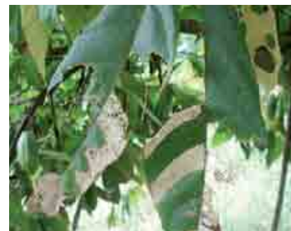
Daño de Stenoma cecropia en hoja