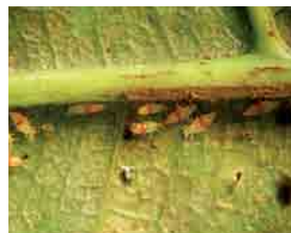
Ninfas de S. rubrocinctus , mostrando la banda roja en el abdomen