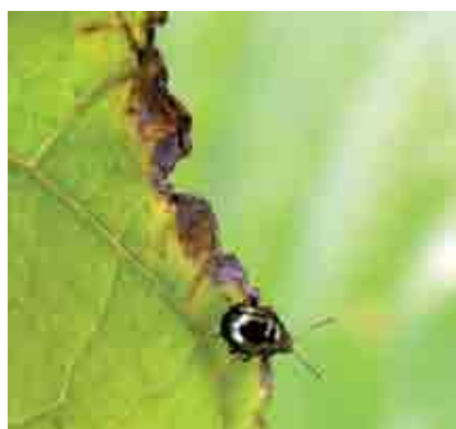
Adulto de Epitrix sp en hoja