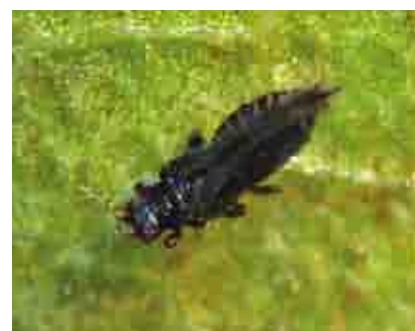
Adulto de S. rubrocinctus

El ciclo de estos insectos va de dos a cuatro semanas, con varias generaciones al año. Los trips se alimentan del envés de las hojas, flores y mazorcas, raspando los tejidos y succionando la savia de las heridas. Un ataque severo provoca defoliación y hasta la muerte de ramas y árboles. Las mazorcas también son afectadas, aunque su daño es menos importante que en el follaje. Las poblaciones se incrementan drásticamente en periodos de sequía o en cacaotales con sombra insuficiente o cuando se elimina súbitamente, causando entonces defoliación.