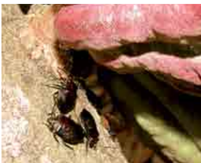
Colonia de chinches negros en pedúnculo de mazorca de cacao

Los chinches propagan en los cacaotales la pudrición negra, la pudrición café, la antracnosis, y en algunos países está reportado que también la Moniliasis.