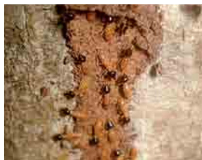
Ninfa y daño de Monalonium

Estos individuos se caracterizan porque tiene la cabeza prolongada anteriormente en forma de un pico angosto por medio del cual exudan una secreción pegajosa con la que se defienden de intrusos.