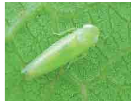
Adulto de Empoasca sp. en envés de hoja de cacao