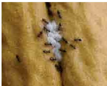
Colonia de cochinillas asociada a otra especie de hormiga