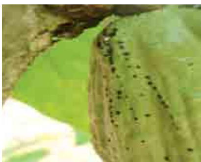
Daño de Antitechus en mazorca de cacao