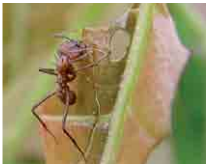
Adulto de hormiga

El daño es más preocupante cuando cortan botones florales y flores. Existe otro grupo de hormigas que no se alimentan directamente de la planta, pero protegen y transportan a varios insectos chupadores que segregan sustancias azucaradas de las que se alimentan. Algunas especies hasta les construyen cubiertas protectoras, desde donde siguen dañando.