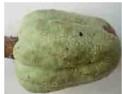
Daño de arañas rojas en mazorca joven

La araña roja es un ácaro y no un insecto, que succiona la savia de las hojas desde el semillero hasta la plantación establecida, causando mayores daños en la época seca, o en plantaciones a pleno sol.