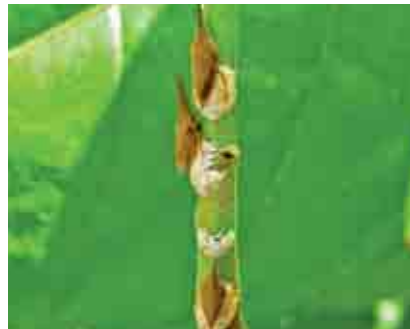
Colonia de membrácidos en rama de cacao

preferentemente en colonias, en frutos pequeños, flores o ramas. Al igual que en el caso de las cochinillas, éstas también son cuidadas por hormigas, mientras que los adultos son de vida libre y potentes saltadores.