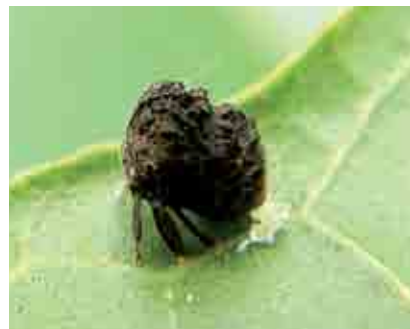
Adulto de membrácido ovipositando sobre envés de hoja de cacao

castaño. La literatura menciona que estos insectos a más del corrugamiento, pueden ocasionar una fuerte atrofia de las hojas, con necrosamiento de los bordes apicales, sintomatología parecida a la provocada por deficiencias de boro.