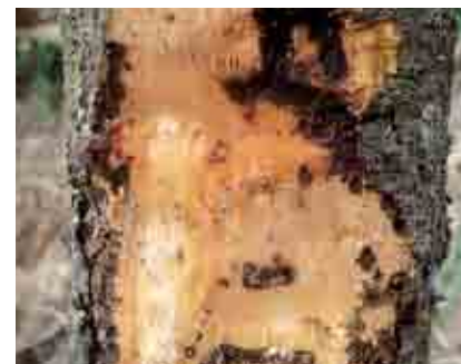
Daño de Xyleborus en tronco de cacao