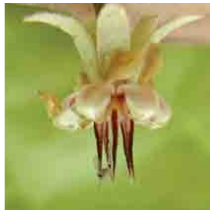
Flor de cacao