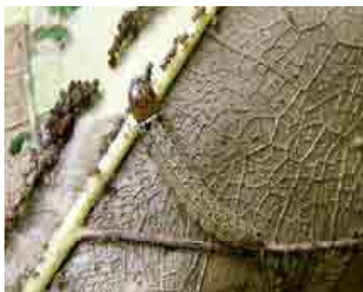
Larva de Stenoma cecropia consumiendo hoja

Los gusanos esqueletizadores son plagas importantes del cacao. En Ecuador son citadas las especies Stenoma cecropia y Cerconota dimorpha . Esta última en su estado adulto es de color cenizo brillante y en reposo presenta forma triangular. La hembra oviposita durante la noche, localizando el mayor número de huevos en el envés de las hojas, en grupos y en forma dispersa, junto a las nervaduras y en la zona intervenal. La duración del ciclo biológico es de aproximadamente 64 días, que corresponden a un periodo de incubación de 4 a 6 días, un estado larvario de 44 días con siete instares. La pupa dura 10 días y la longevidad del adulto es de 6 días. Luego de la incubación, la larva permanece quieta, para luego dirigirse a la nervadura central o secundaria y comienza a alimentarse del parénquima y construir su nicho.