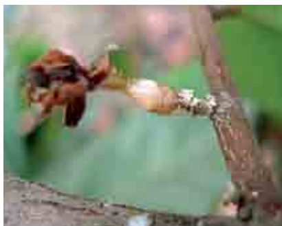
Ninfa de salivazo en flor de cacao

banda roja que rodea la base del abdomen y son gregarias, mantienen levantado la punta del abdomen mientras caminan cargando una pequeña gota de excremento líquido suspendido en los pelos terminales del mismo, las gotas se desprenden periódicamente cayendo sobre la hoja o fruto, donde se secan y forman puntos bronceados o parduzcos; las mazorcas muy dañadas, toman un color café sucio, que no permite saber cuando están maduras, dificultando la cosecha.