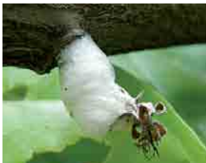
Espuma causada por la secreción de ninfas de salivazo