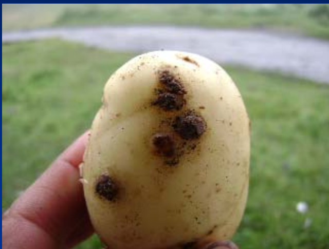
Fase inicial (pequeñas ampollas)