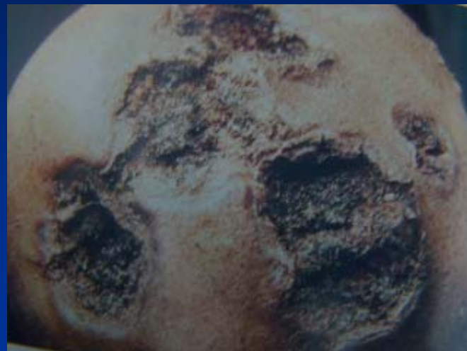
Fase avanzada (pústulas abiertas)