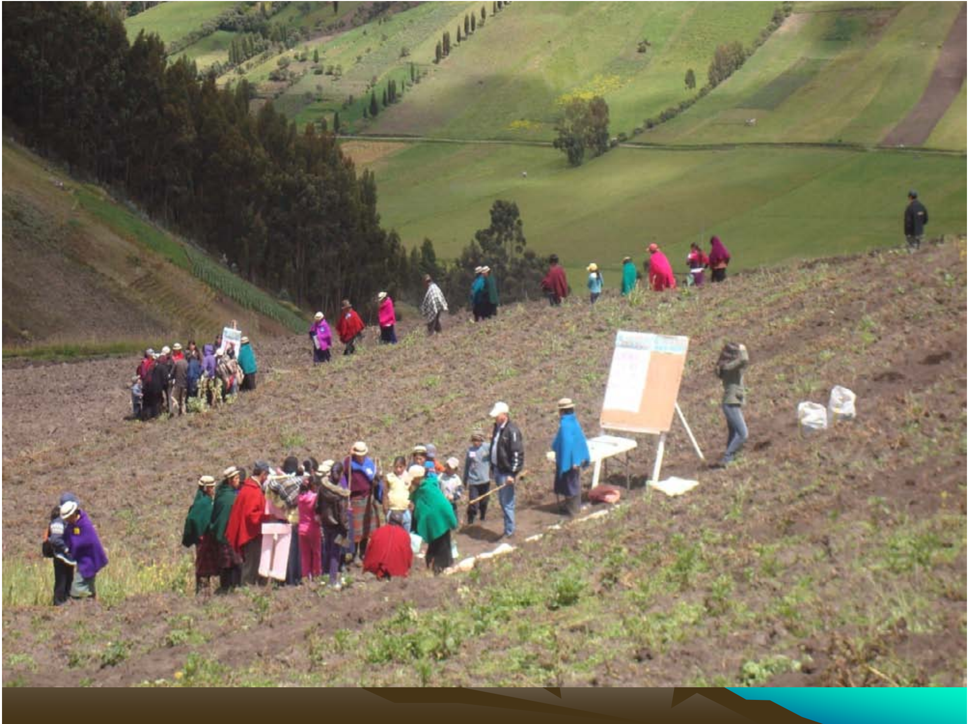
INIAP - Estación Experimental Santa Catalina