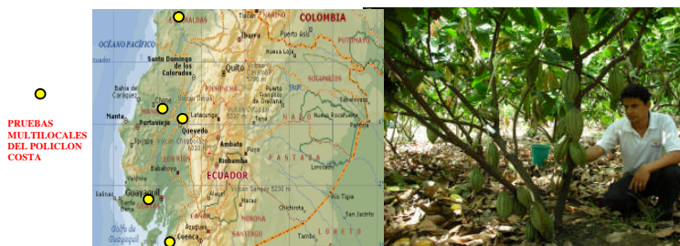
Fig. 1. Izquierda, ubicación de los experimentos de cacao Nacional a nivel regional, derecha, Clon EET-558 mostrando su alto potencial productivo en la zona de Chongón. Granja CEDEGE