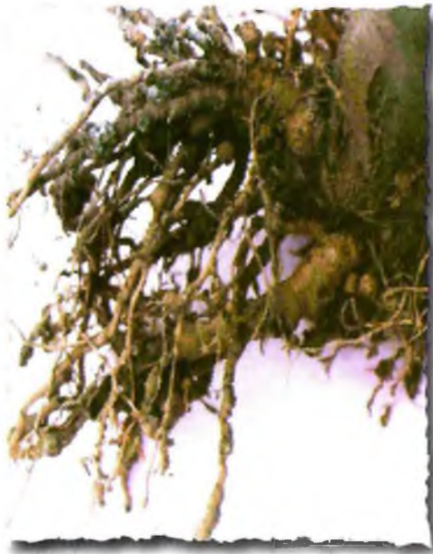
Foto 1. Raíces con agallas y pudrición

maticidas sistémicos cada tres meses, que se acumulan en el fruto afectando la calidad y la salud de los productores y consumidores.