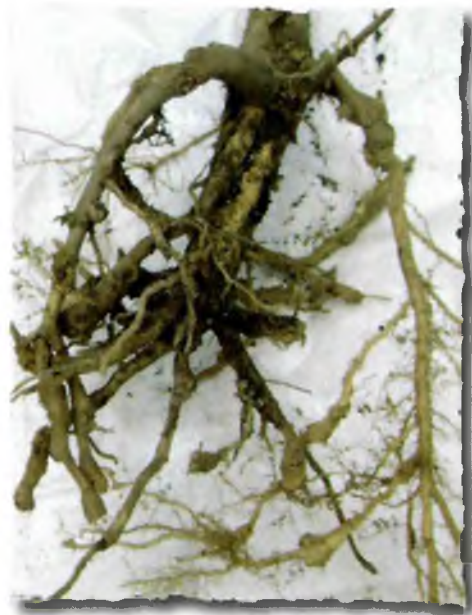
Foto 21. Raíz de planta de tomate sin injertar atacada por nematodos