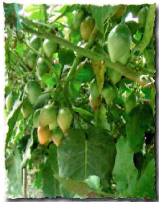
Foto 18. Alta producción tomate