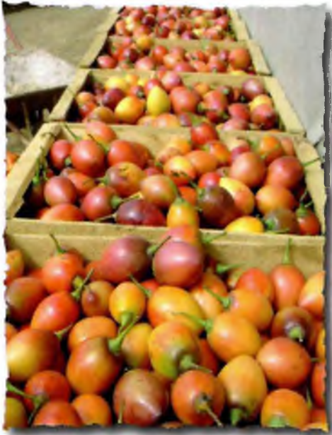
Foto 19. Fruta de calidad