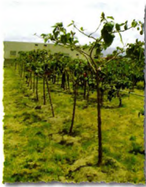
Foto 2. Plantas de poco crecimiento

La presencia de la enfermedad “Mancha negra del tronco” o “Pata de puerco” se registra a partir de los años 90 en la provincia de Tungurahua. En la actualidad está presente en las provincias de Imbabura, Pichincha, Tungurahua y Azuay, las que cuentan con significativas superficies cultivadas con este frutal. En Azuay y Tungurahua se han registrado lotes aniquilados por su ataque.