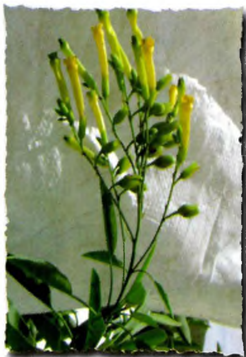
Foto 6. Inflorescencia N. glauca