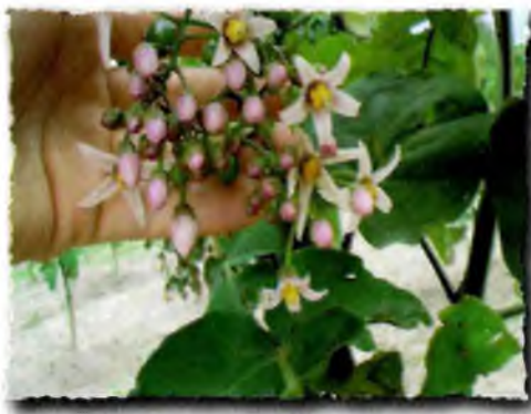
Foto 15. Plantas injertas con floración precoz

Las plantas injertas de tomate de árbol son más pequeñas y precoces comparadas con las provenientes de semilla. Además, presentan una copa más abierta por lo que necesitan mayor distancia de plantación con el fin de permitir el paso de luz.