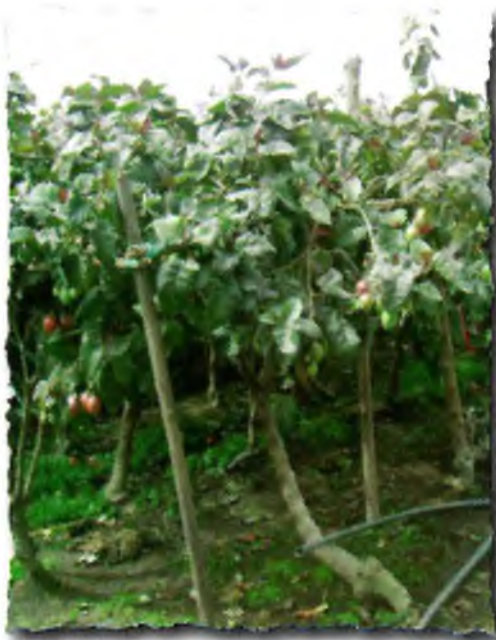
Foto 17. Plantación de tomate injerto

La resistencia del tabaquillo y la tolerancia del palo blanco a nematodos, permiten mejorar la producción debido al mayor rendimiento y longevidad de la planta.