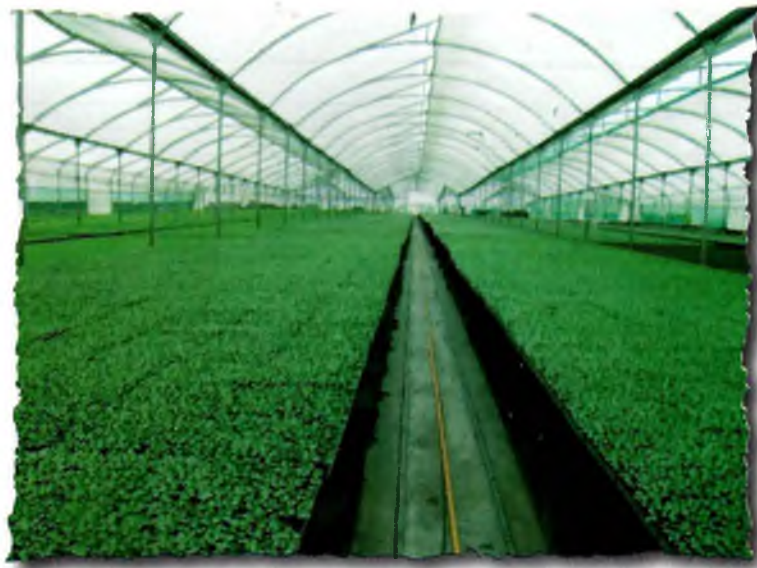
Foto 26. Viveros de producción de plantas

El INIAP a través de la Granja Tumbaco, produce y distribuye plantas de tomate de variedades anaranjadas y moradas injertadas en patrones resistentes de solanáceas silvestres. Para mejorar este servicio, el INIAP ha suscrito un convenio con la empresa Pilonés La Victoria S.A. PILVICSA, quien tiene gran experiencia en la producción y distribución de plantas de calidad, y podrá atender las demandas de que los productores del país requieran.