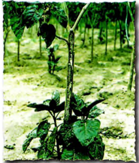
Foto 4. Planta atacada por mancha negra

Debido a la escasa variabilidad genética del tomate de árbol, la evaluación de especies silvestres de solanáceas resistentes al Nematodo del nudo de la raíz ( Meloidogyne incognita ) y al hongo Fusarium solani , se consideró el uso de plantas injertas de tomate árbol en solanáceas silvestres resistentes o tolerantes a nematodos, como una alternativa apropiada y sostenible, para no depender exclusivamente del control químico y limitar, principalmente, el uso de pesticidas.