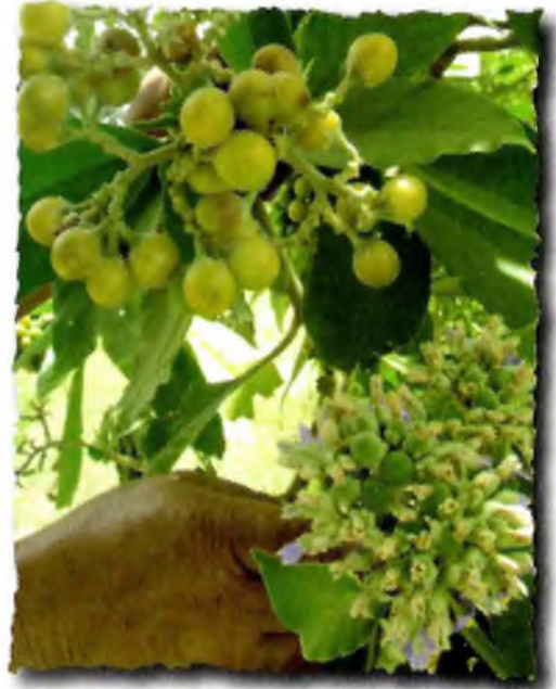
Foto 8. Flores y frutos S. auriculatum