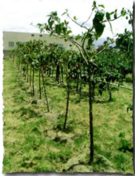
Foto 20. Planta sin injertar