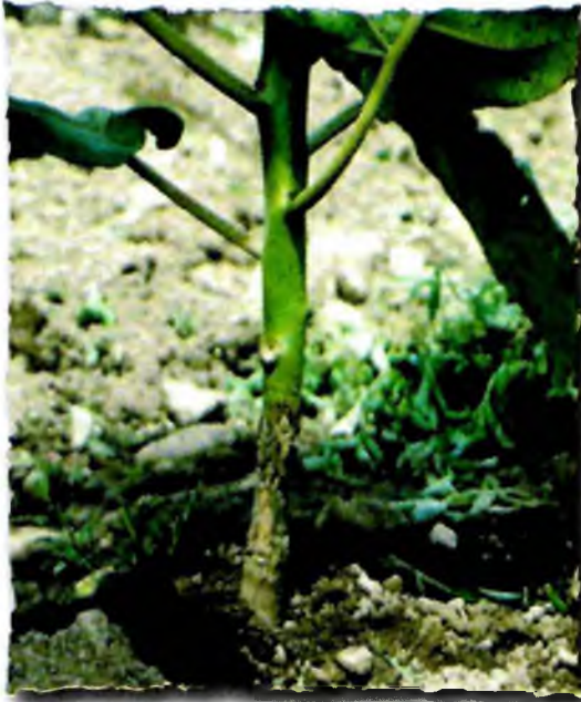
Foto 3. Planta con síntoma de infección de mancha negra