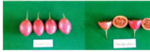
Foto 24. Frutos de gigante morado