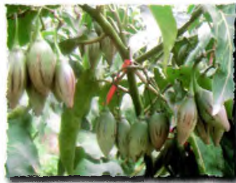
Foto 16. Injertos con producción más temprana