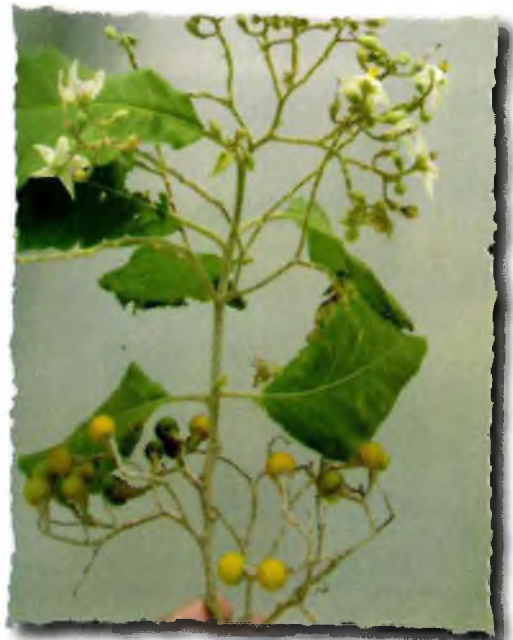
Foto 10. Flores y frutos S. hispidum