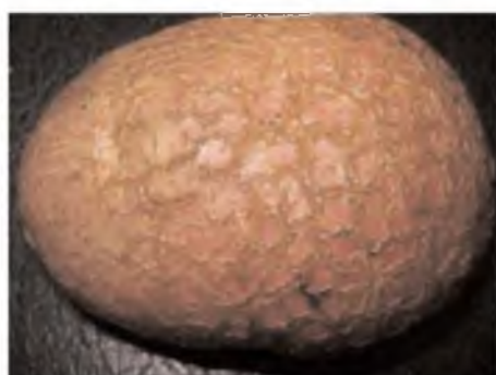
Mancha cubriendo toda la superficie del tubérculo, síntoma final