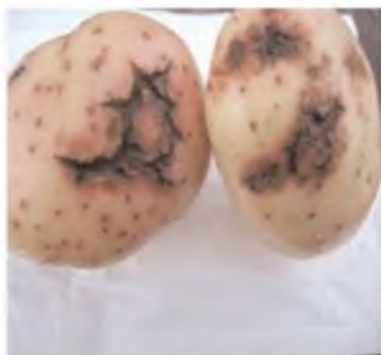
Mancha de forma estrellada, síntoma inicial