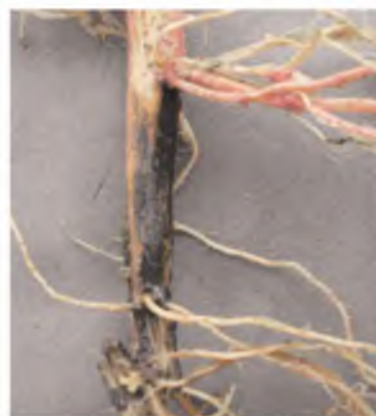
Necrosis en cuello y raíces