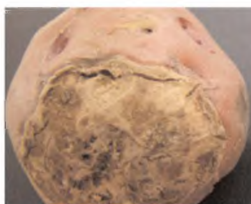
Manchas unidas formando grandes áreas de infección, síntoma final