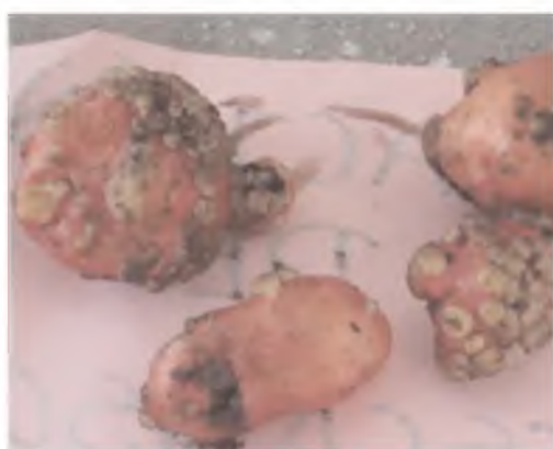
Ampollas de color blanquecino, síntoma inicial