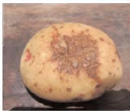
Mancha en formas geométricas o poliédrica, síntoma inicial