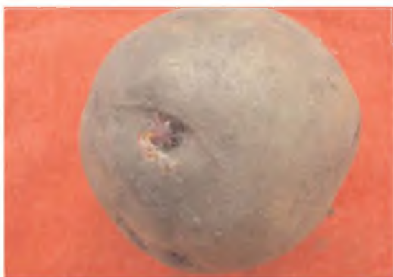
Semilla de calidad