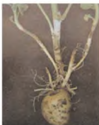
Mancha algodonosa en el cuello