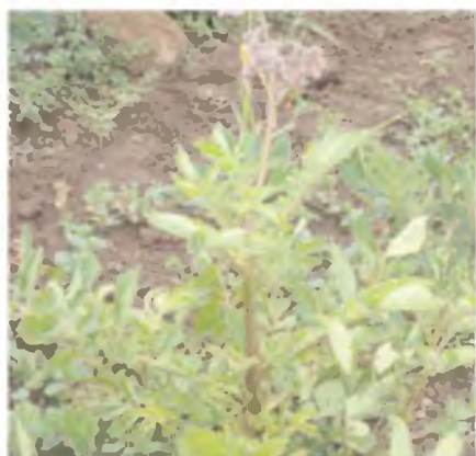
Hojas superiores enrolladas y amarillentas