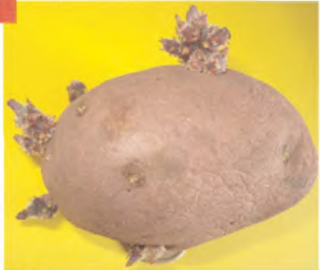
Tuberculo semilla con brotes desarrollados