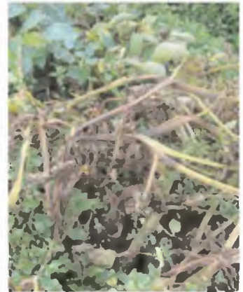
Planta con tallos muertos