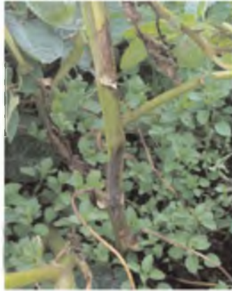
Tallo con pudrición inicial