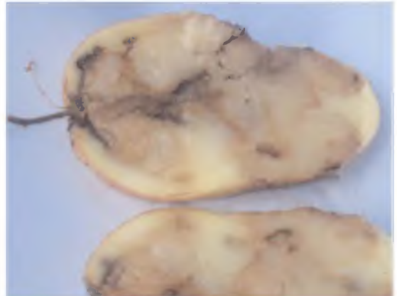
Corte transversal de tubérculo enfermo