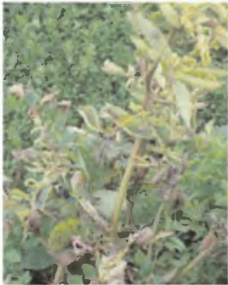
Hojas superiores enrollamiento y amarillentas, síntoma inicial