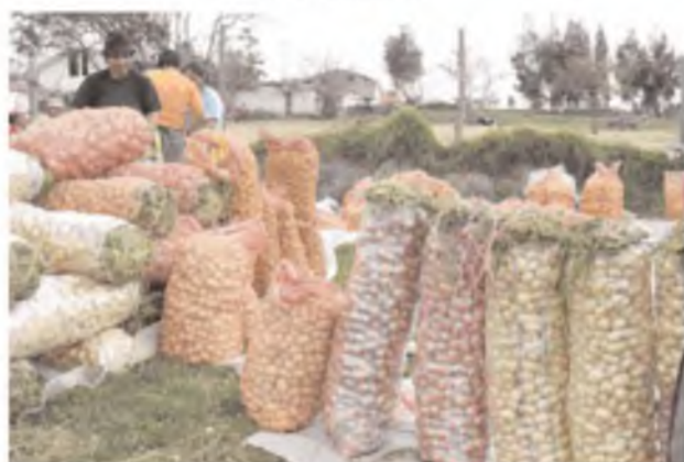
Papa sana o limpia