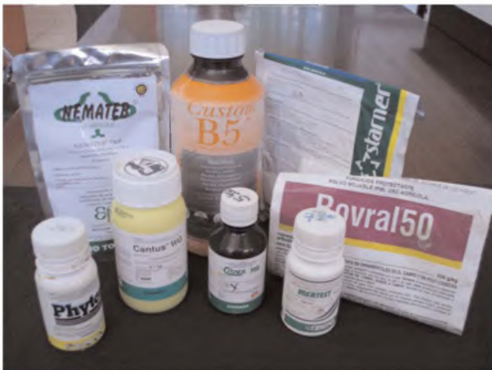
Desinfectantes de semilla y suelo