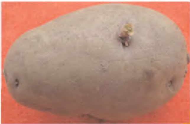
Tubérculo semilla con brote inicial