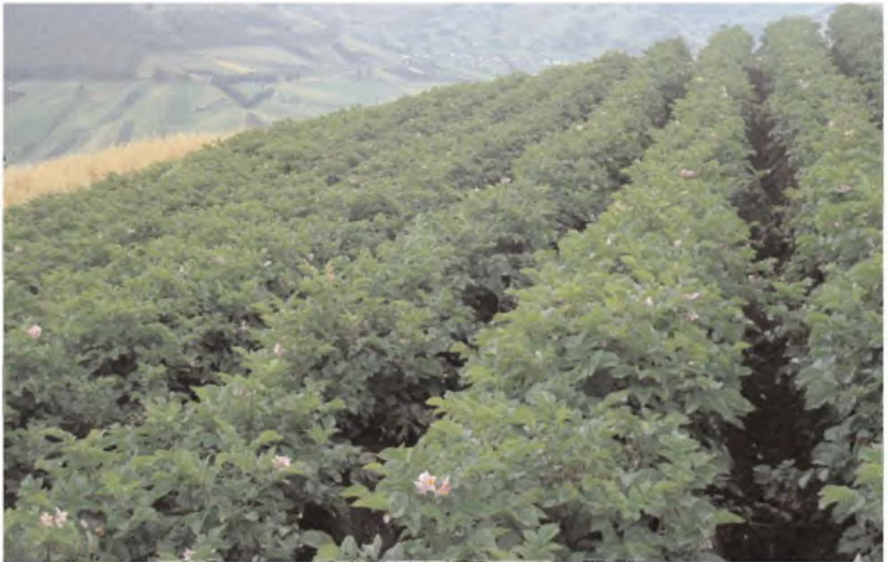
Cultivo sano, plantas bien desarrolladas