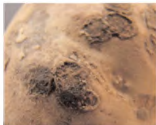
Tubérculo con manchas abiertas y oscuras