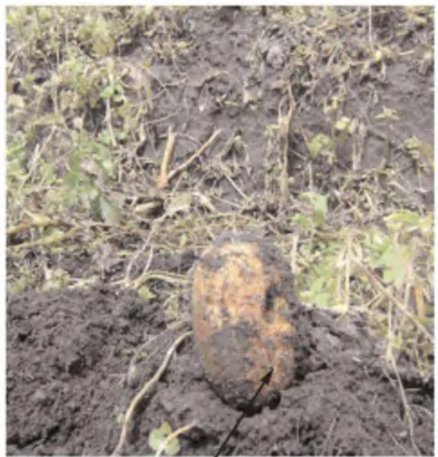
Quistes en tubérculos