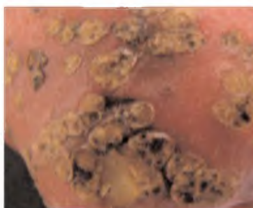
Tubérculo con ampollas redondeadas y oscuras