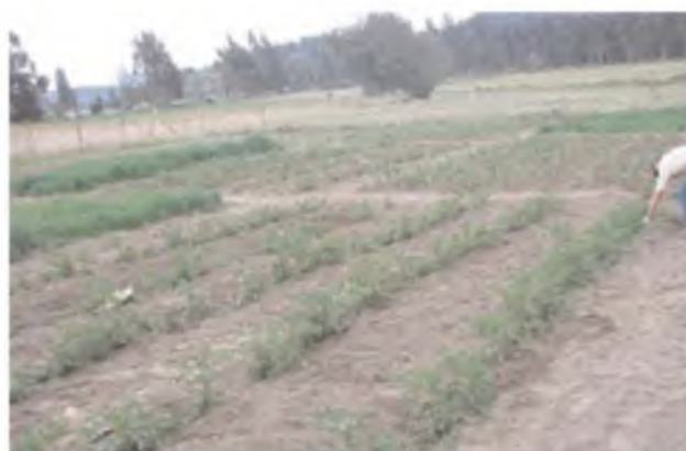
Suelo de rotación