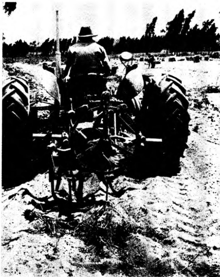
FOTO 1.- Cavadora de molinete.