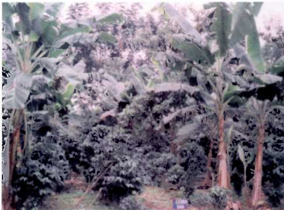
Fig. 2. Cultivo de café “Caturra rojo” produciendo bajo un sistema agroforestal en Pichilingue.

El contenido de materia orgánica es relativamente alto en los dos lugares, posiblemente como resultado de un remanente de los aportes de biomasa de las huertas antiguas, particularmente en Pichilingue. Sin embargo, es importante resaltar que en Caluma el contenido de materia orgánica es mas alto en las parcelas de ambos cultivos cuando se asocian con Laurel y Pachaco.