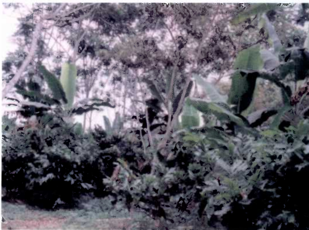
Fig. 1 Cultivo de cacao bajo un sistema agroforestal guabo, plátano en la zona de Caluma.