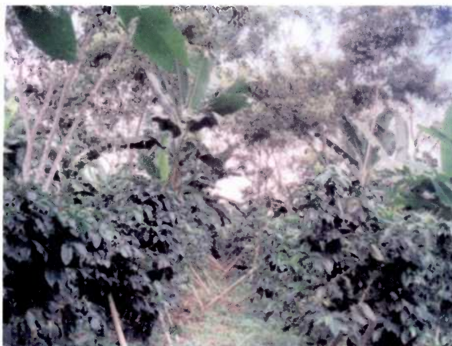
Fig. 3. Cultivo de café manejado bajo un sistema agroforestal con guabo en el sector de Caluma.