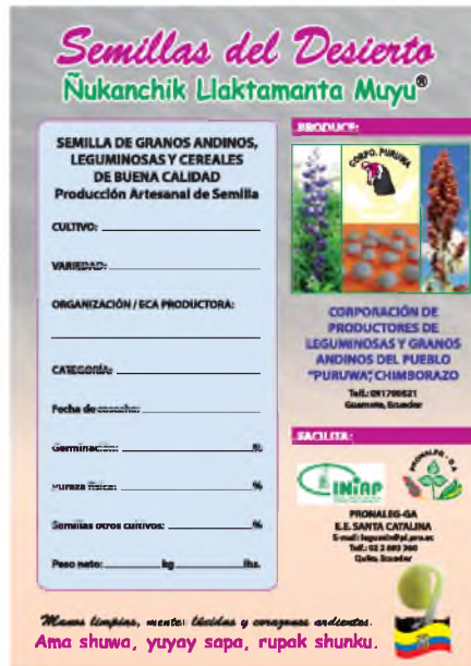
Figura 2. Etiqueta para la distribución de semilla seleccionada de buena calidad de granos andinos y cereales de la CORPOPURUWA, Guamote.