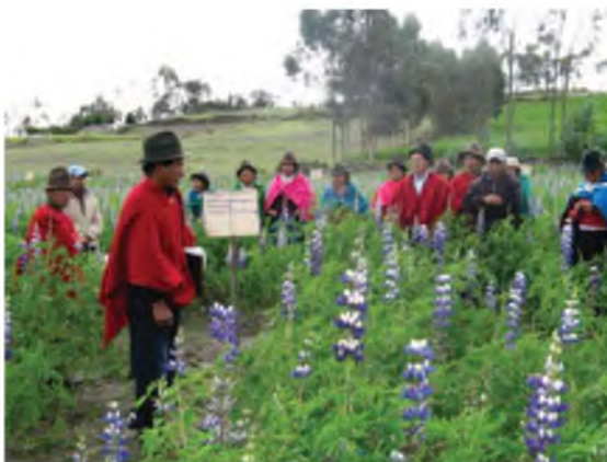
Fotografía 5. ECA de Mushuk Pakari, evaluando parcelas de chocho.

Capacitación y difusión de la diversificación del consumo de granos andinos ( Fotografía 6 ).