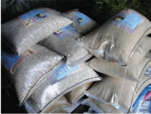
Fotografía 12. Semilla seleccionada de buena calidad de chocho y quinua de la CORPOPURUWA lista para ser distribuida. Guamote, 2010.