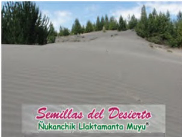
Fotografía 7. Vista general de las condiciones edafoclimáticas de las comunidades socias de la CORPOPURUWA, razón de su marca de semillas.

Producción y distribución de semilla seleccionada de buena calidad de chocho, quinua y cebada a través de la marca “ Semillas del Desierto ” (Fotografías 7, 8, 9, 10, 11, 12; Figura 2).