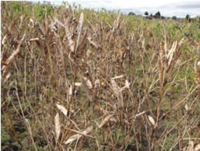
Fotografía 11. Lote de semilla de la variedad de chocho INIAP 450 Andino en madurez de cosecha. Guamote, 2010.