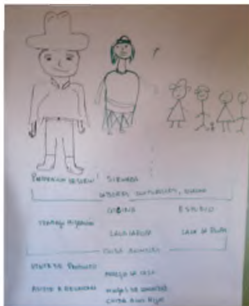
Fotografía 3. Diagrama de la distribución de actividades agrícolas por género en comunidades socias de la CORPOPURUWA .