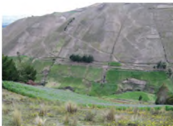
Fotografía 2. Vista general de la topografía de las comunidades de Guamote socias de la CORPOPURUWA .

El Cantón Guamote se encuentra localizado en la parte central del callejón interandino, a 50 km al sur de la ciudad de Riobamba, Ecuador. Abarca un territorio de 1.223,3 km (INEC) que representa el 18,9% de la extensión territorial provincial de Chimborazo y significan más de 100.000 ha de cultivo, en 10.287 Unidades de Producción Agropecuaria (UPAs). Las comunidades socias se ubican desde los 3.000 hasta los 3.600 m de altitud; con topografía irregular, presentando pendientes pronunciadas, que en algunos casos sobrepasan el 50%; constituyendo una de las principales causas de la erosión de los suelos, junto a la acción fluvial. En general, de octubre a mayo predomina el clima húmedo y frío y de junio a septiembre predomina el verano cálido, seco y ventoso ( Fotografía 2 ).