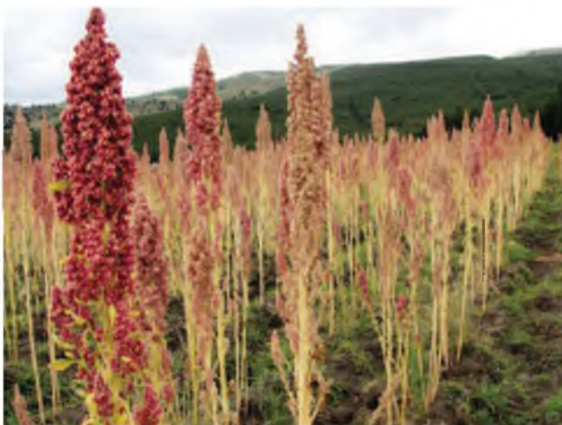
Fotografía 8. Lote de multiplicación de semilla de la variedad de quinua INIAP Tunkahuan, en la Granja Tototillas, Guamote.