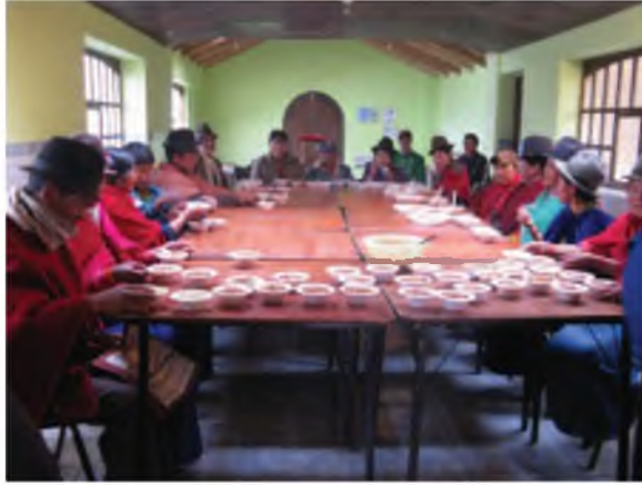
Fotografía 6. Degustación de platos en base de quinua, chocho y amaranto. Granja Totorillas, Guamote.

Producción y distribución de semilla seleccionada de buena calidad de chocho, quinua y cebada a través de la marca “ Semillas del Desierto ” (Fotografías 7, 8, 9, 10, 11, 12; Figura 2).