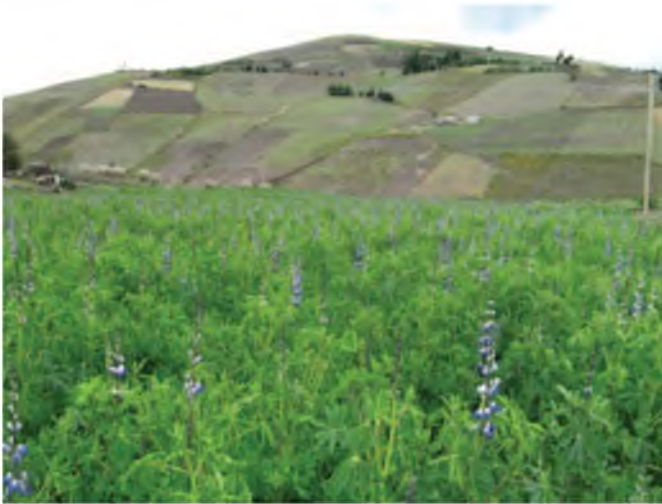
Fotografía 10. Lote de multiplicación de semilla de la variedad INIAP 450 Andino. Pull San Pedro, Guamote.