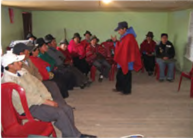
Fotografía 1. Participantes en el Taller de Planificación Estratégica de la CORPOPURUWA . Pull San Pedro, Guamote.