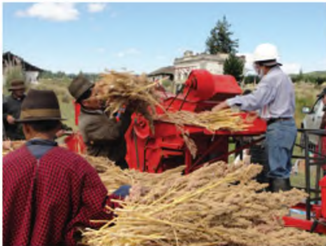
Fotografía 9. Trillado del lote de multiplicación de semilla de quinua. Granja Totorillas, Guamote.