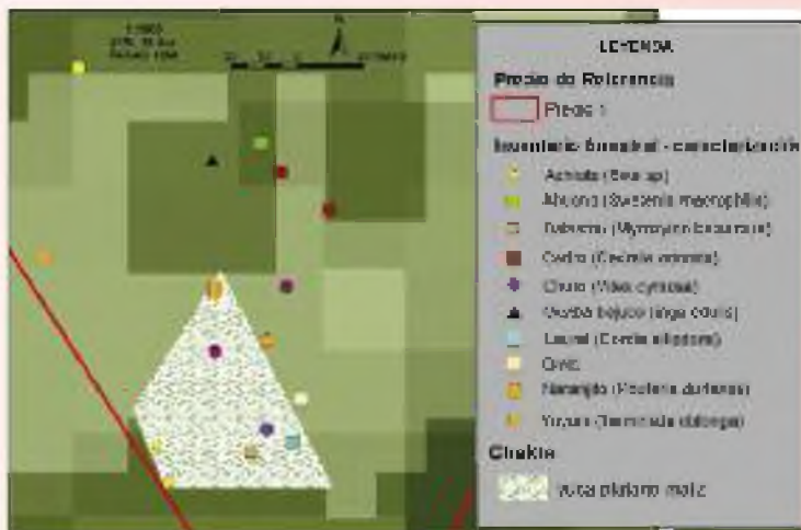
GRÁFICO 1. Shuk Shuyupi. Chakra niskata rikuy kunamanta

Kay chikan, chikankunami, cacao tarpunay ashka yanaparishka, kay sumak asnak cacao ukupi lumu, palandakunata imasami yurakuna tarpunkak ashka yanaparishka, kay ish kay shuyupi rikuchishka shina.