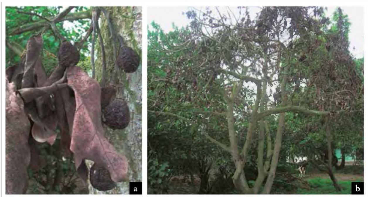
Figura 1. Árboles de aguacate con sintomatología asociada a pudrición radicular (Puéllaro, Pichincha). a. Momificación de frutos y secamiento de hojas; b. Marchitez general del árbol y caída de hojas.

La toma de muestras se realizó en fincas y huertos de pequeños productores en las provincias de Tungurahua y Pichincha, tomando raíces de árboles (a una profundidad de 20 cm) que presentaban la sintomatología asociada a la pudrición radicular: secamiento de ramas y de hojas, momificación de frutos y caída de hojas, tal como se indica en la figura 1.